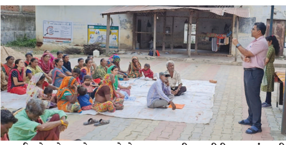
ભરાઈ રહેવાને પગલે મચ્છરોનો ઉપદ્રવ જોવા મળી રહ્યો છે જેથી મેલેરીયા અને ડેન્ગ્યુના બિમારીના કેસ વધ્યા છે. ત્યારે વધી રહેલા મચ્છરજન્ય રોગચાળાને કાબુમાં કરવા માટે જિલ્લા આરોગ્ય તંત્ર દ્વારા ખાસ એક્શન પ્લાન તૈયાર કરવામાં આવી હતી. મમતા દિવસે

બ્રીડીંગ વધ્યું છે. શહેર-જિલ્લામાં મેલેરીયા અને ડેન્ગ્યુના કેસમાં ઉછાળો જોવા મળે છે. ઘર અને નોકરીના સ્થાને કેટલાક સ્થળે પાણી કરાયો છે. જેને અન્વયે ગત સોમવારે ગ્રામ્ય વિસ્તારની દુકાનો, જાહેર સ્થળો, સંસ્થાઓ, સહિતના સ્થાનો પર સર્વેલન્સની એન્ટી સગભા બહેનો અને ધાર્મિકસ્થાનોને જાગૃત કરવામાં આવ્યા હતા. ગુરુવારે ગાંધીનગર ગ્રામ્ય વિસ્તારની ૨૬૭ શાળાઓમાં આરોગ્યની ટીમ દ્વારા શિક્ષકો તેમજ વિદ્યાર્થીઓને મચ્છરના પોરા નિર્દેશન અને ગળી માછલીની કામગીરીથી માહિતગાર કર્યા હતા. જયારે મચ્છરના નિયંત્રણ અંગે વિદ્યાર્થીઓને સવિસ્તાર સમજણ પુરી પાડી હતી. દરેક શાળામાં ૧૦ મીનીટ મચ્છરજન્ય રોગચાળાને અંકુશમાં લેવા માટેના અટકાયતી પગલા અંગે વિદ્યાર્થીઓને જાગૃત કરવા જણાવ્યું હતું. જયારે મેલેરીયા અને ડેન્ગ્યુને કાબુમાં કરવા માટે ખાસ એક્શન પ્લાનની વિવિધ કામગીરીમાં આરોગ્યના કમચારીઓએ સુપેરે પોતાની ફરજ બજાવી હતી.