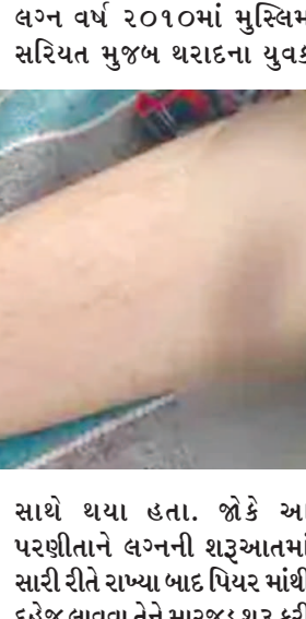
સાથે થયા હતા. જોકે આ પરણીતાને લગ્નની શરૂઆતમાં સાસરીતે રાખ્યા બાદ પિયર માંથી દહેજ લાવવા તેને મારજુડ શરૂ કરી

પાલનપુર તા. ૧૨ પાલનપુર તાલુકાના કાણોદરમાં એક પરિણીતાએ ત્રણ દીકરીઓને જન્મ આપ્યા બાદ તેના પતિ સહિત સારારિયાઓએ ગર્ભપાત કરાવ્યો હતો. તેને ગરમ સાણસીથી ડામ આપ્યા હતા. અને ત્રણ તલાક આપી દીકરીઓ સાથે તરછોડી મૂકી હતી. જેણે થરાદના સાસરીયાઓ સામે કાર્યવાહી કરવા ગુરુવારે જિલ્લા પોલીસવાડાને રજૂઆત કરી હતી. આ અંગે વધુ વિગતો આપતાં અમારા બનાસકાંઠા જિલ્લાના સંવાદદાતા હરેશ જી. જોષી પાલનપુર નો અહેવાલ જણાવે છે કે, વડગામ તાલુકાના સેજલપુરા ગામની વતની અને