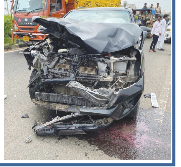
પુરપાટ ઝડપે પસાર થતી ફોર્યુનર કારની વચ્ચે રોડ પર ગાય આવી જતા ધડાકાભેર અકસ્માત સર્જાતા ગાયનું સ્થળ પર મોત નીપજ્યું હતું ફોર્યુનરના આગળના ભાગના ભુક્કા બોલાઈ ગયા હતા ફોર્યુનરે ગાયને ટક્કર મારતા લોકો રોડ પર દોડી આવ્યા હતા સદનસીબે ફોર્યુનર ચાલક અને સવાર લોકોનો આભાદ બચાવ થતા લોકોએ હાથકારો અનુભવ્યો હતો મોડાસા શહેરના મુખ્યમાર્ગો, રહેણાંક વિસ્તારના રોડ-રસ્તા પર અને હાઈવે પર બેઠેલી ગાયોની ભરમાર જોવા મળે છે અનેક અકસ્માત થવા છતાં તંત્રના પેટનું પાણી પણ હલતું નથી.