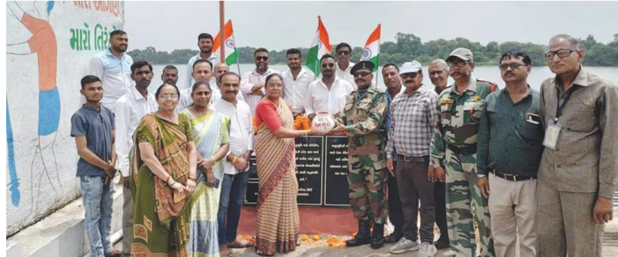
હતા. વીર શહીદોની યાદમાં અમૃત સરોવર સહિતનાં જળાશયો પાસે, શાળાના મેદાનમાં, પંચાયત ખાતે

અંતર્ગત જનભાગીદરી થકી ભવ્ય ઉજવણી કરાઈ હતી અને વિવિધ કાર્યક્રમોનું આયોજન કરવામાં આવ્યું હતું. જેમાં વીરોને નમન કરવાના હેતુથી તમામ પંચાયતમાં શિલાફલકમનું નિર્માણ કરાયું હતું. આ ઉપરાંત ગ્રામજનો દ્વારા ગામ દીઠ ૭૫ જેટલા વૃક્ષોનું વાવેતર કરવામાં આવ્યું હતું. વધુમાં ગામના લોકોએ ભેગા મળી હાથમાં માટી અને માટીનો દીવો લઈ રાષ્ટ્રની એકતા અને અખંડિતતા માટે સામૂહિક પ્રતિજ્ઞા લીધી હતી. આ ઉપરાંત વીર શહીદોના પરિવારજનોનું સન્માન પણ કરવામાં આવ્યું હતું. તમામ ગ્રામ પંચાયત કક્ષાએ યોજાનાર કાર્યક્રમમાં સ્થાનિક આગેવાનો અને પદાધિકારીશ્રીઓની ઉપસ્થિતિમાં ધ્વજવંદનનો કાર્યક્રમ પણ યોજાયો હતો.