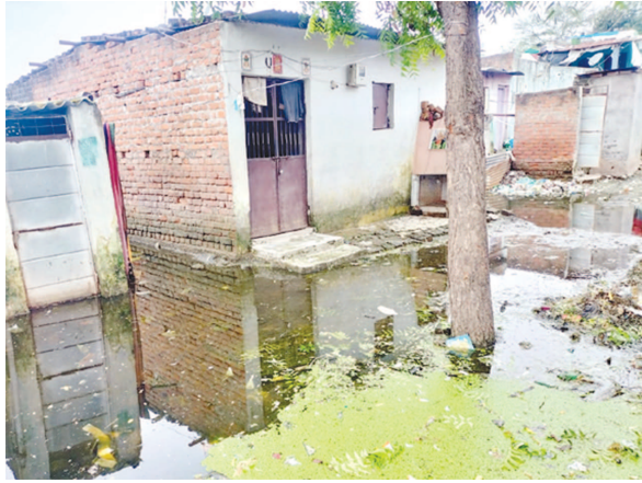
રહેતા હોવાનું જણાઈ આવ્યું છે તેમ છતાં તેમના મકાનો આસપાસ એન્ટીલાવલ કામગીરી કરવાની સાથે મચ્છર ઉપદ્રવના સ્થાનો સુધી જરુરી કામગીરી ટીમો દ્વારા કરવામાં આવી છે.

ચકાસણી દરમિયાન જણાઈ આવ્યું છતાં તમામ વિસ્તારોમાં એન્ટીલાવલ કામગીરી શરુ કરી દેવામાં આવી છે. અત્યાર સુધીમાં ૧૫ દિવસ પછી પણ વરસાદી પાણી ઓસર્યાં નથી જેના કારણે ડુબાઉ વિસ્તારોની પ્રજા ચામડી રોગના સંક્રમણમાં આવવાની સાથે મચ્છરોનો ઉપદ્રવ વધતાં શંકાસ્પદ ડેન્જ્યુના કેસમાં ઉછાળો આવી રહ્યો છે. બાયડ ઉપરાંત આંબાગામ, ડામર સહિતના અનેક ગામડાઓ સુધી ડેન્જ્યુના દર્દીઓ જોવા મળ્યા છે જેમાંના મોટાભાગના દર્દી અભ્યાસ તેમજ નોકરી અર્થે અન્ય જિલ્લામાં રહેતા હોવાનું પણ આરોગ્ય વિભાગની