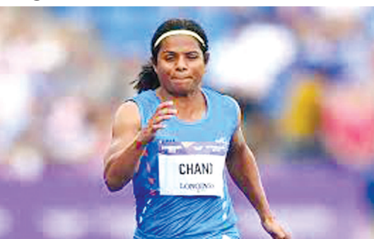
નવી દિલ્હી, તા. ૧૮ ભારતીય એથલેટ દુતી ચંદ પર એનએડીએએ ૪ વર્ષનો પ્રતિબંધ લગાવવામાં આવ્યો છે. આ પ્રતિબંધ ડોપિંગના કારણે મુકવામાં આવ્યો છે. દુતીનો ટેસ્ટ થયો હતો જેમાં સિલેક્ટિવ એન્ડોર્જન રીસેપ્ટર મોડ્યુલેટર મળી આવ્યા હતા. દુતી પર લાદવામાં આવેલ ચાર વર્ષનો પ્રતિબંધ જાન્યુઆરી ૨૦૨૩થી ધ્યાનમાં લેવામાં આવશે. તેણે વર્ષ ૨૦૨૧માં ગ્રાન્ડ પ્રિક્સમાં ૧૦૦ મીટરની દોડ ૧૧.૧૭ સેકન્ડમાં પૂરી કરીને રાષ્ટ્રીય રેકોર્ડ બનાવ્યો હતો. દુતીએ ઘણી ઈવેન્ટોમાં સારું પ્રદર્શન કર્યું છે. દુતીએ એશિયન ગેમ્સ ૨૦૧૮માં ૧૦૦ મીટર અને ૨૦૦ મીટરમાં બે ગોલ્ડ મેડલ જીત્યા

ભારતીય એથલેટ દુતી ચંદ પર ડોપિંગ કેસમાં ૪ વર્ષનો પ્રતિબંધ સિલેક્ટિવ એન્ડોર્જન રીસેપ્ટર મોડ્યુલેટર મળી આવ્યા : દુતી પર લાદવામાં આવેલ ચાર વર્ષનો પ્રતિબંધ જાન્યુઆરી ૨૦૨૩થી ધ્યાનમાં લેવામાં આવશે નવી દિલ્હી, તા. ૧૮ ભારતીય એથલેટ દુતી ચંદ પર એનએડીએએ ૪ વર્ષનો પ્રતિબંધ લગાવવામાં આવ્યો છે. આ પ્રતિબંધ ડોપિંગના કારણે મુકવામાં આવ્યો છે. દુતીનો ટેસ્ટ થયો હતો જેમાં સિલેક્ટિવ એન્ડોર્જન રીસેપ્ટર મોડ્યુલેટર મળી આવ્યા હતા. દુતી પર લાદવામાં આવેલ ચાર વર્ષનો પ્રતિબંધ જાન્યુઆરી ૨૦૨૩થી ધ્યાનમાં લેવામાં આવશે. તેણે વર્ષ ૨૦૨૧માં ગ્રાન્ડ પ્રિક્સમાં ૧૦૦ મીટરની દોડ ૧૧.૧૭ સેકન્ડમાં પૂરી કરીને રાષ્ટ્રીય રેકોર્ડ બનાવ્યો હતો. દુતીએ ઘણી ઈવેન્ટોમાં સારું પ્રદર્શન કર્યું છે. દુતીએ એશિયન ગેમ્સ ૨૦૧૮માં ૧૦૦ મીટર અને ૨૦૦ મીટરમાં બે ગોલ્ડ મેડલ જીત્યા