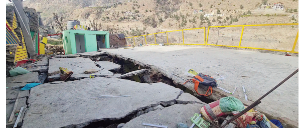
અનેક ઘરોમાં તિરાડો આવ્યા બાદ ઉપરાજ્યપાલ મનોજ સિન્હાએ તિરાડો સામે આવ્યા બાદ ત્રણ મકાનો ધરાશાયી થયા છે અને ૧૮

જમ્મુ, તા.૫ ડોડા જિલ્લાના એક ગામમાં કહ્યું કે, તેઓ પરિસ્થિતિ પર ધ્યાન રાખી રહ્યા છે. નવી બસ્તી ગામમાં અન્ય મકાનો અસુરક્ષિત જોવા મળ્યા છે. ભારત સરકારની ભૂગર્ભ સર્વેક્ષણની ટીમે ગામમાં જઈને પરિસ્થિતિનું નિરીક્ષણ કર્યું હતું. આ વિસ્તારના એસડીએમે કહ્યું કે, શનિવારે કોઈ નવી ઈમારતમાં તિરાડો જોવા મળી નથી. આ દરમિયાન ઉપ રાજ્યપાલે ગામની તુલના ઉત્તરાખંડના જોશીમઠ સાથે કરવાનો ઈનકાર કરી દીધો હતો. તેઓએ કહ્યું કે, અસરગ્રસ્તોને દરેક પ્રકારની મદદ કરવામાં આવશે.