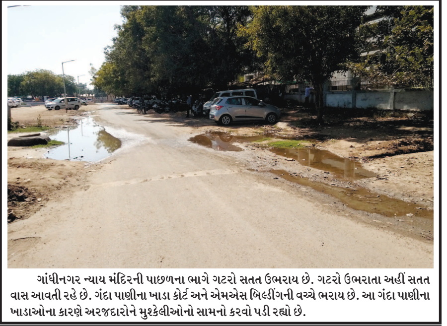
ગાંધીનગર ન્યાય મંદિરની પાછળના ભાગે ગટરો સતત ઉભરાય છે. ગટરો ઉભરાતા અહીં સતત વાસ આપતી રહે છે. ગંદા પાણીના પ્લાઝ કોર્ટ અને એમએસ બિલ્ડિંગની વચ્ચે ભરાય છે. આ ગંદા પાણીના ખાડાઓના કારણે અરજદારોને મુરકેલીઓનો સામનો કરવો પડી રહ્યો છે.

ગાંધીનગર, તા. ૮ ગાંધીનગર સિવિલ કેમ્પસમાં કેટલીક પડતર જગ્યાઓ પર વિવિધ વૃક્ષના છોડ વાવીને અવનવા ઉદ્યાનના નામ આપવામાં આવ્યા હતા. લાખો રૂપીયાના ઉદ્યાન ઝાંખી ઝાંખરામાં ફેરવાઈ ગયા છે. માવજતને અભાવે ઉદ્યાન જંગલ બની ગયા છે. ત્યારે સિવિલ કેમ્પસમાંથી ઝડપી આ બિન ઉપયોગી ઉદ્યાન દુર કરી તે સ્થાન પર પેવર બ્લોક નાંખી તે જગ્યાનો સડઉપયોગ કરવામાં આવે તેવી ચર્ચા ચાલી રહી છે. મળતી વિગત મુજબ મચ્છરોના ત્રાસ વધતા દર્દીઓ પણ હેરાન પરેશાન થઈ જાય છે. સિવિલ બિનઉપયોગી ઉદ્યાનની જગ્યા પર પેવર બ્લોક નાંખી તે જગ્યાનો તંત્ર દ્વારા સડઉપયોગ કરવામાં આવે તેવી ચર્ચાઓ સિવિલ કેમ્પસમાં ચાલી રહી છે. ત્યારે ઉદ્યાન પાછળ લાખો રૂપીયાનો ખર્ચ કરવામાં આવ્યો હતો. જે તે સમયે ઉદ્યાનની માવજત માટે લાખો રૂપીયાના સાધનો પણ વસાવવામાં આવ્યા હતા. ત્યારે હાલના સમયે તે ઉદ્યાનના સાધનો પણ છે કે નહી તે પ્રશ્ન છે.