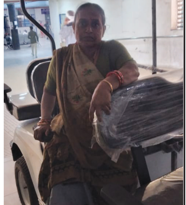
કરવો પડતો હતો. તેના સ્થાને હવે આ ગોલ્ડ કોર્ટનો ઉપયોગ કરવામાં આવશે. આ ગોલ્ડ કોર્ટ દર્દીઓ માટે આશિર્વાદરૂપ સાબિત થશે. ગતરોજથી દર્દીઓ માટે ગોલ્ડ કોર્ટની સેવા શરૂ કરી દેવામાં આવી છે. કેટલાક અશક્ત અને ગંભીર ઈજાગ્રસ્ત દર્દીઓને ઓપીડી કે નવી બિલ્ડિંગ સુધી લેવા મુશ્કેલી પડતી હતી. ગોલ્ડ કોર્ટનો ઉપયોગ કરવામાં આવતા દર્દીઓમાં પણ ખુશી જોવા મળી રહી છે.

મળતી વિગત મુજબ કેનેરા બેંક દ્વારા ગોલ્ડ કોર્ટનું દાન મળ્યું છે. ત્યારે આ ગોલ્ડ કોર્ટ હોસ્પિટલમાં આવતા અશક્ત, વૃદ્ધ અને ગંભીર દર્દીઓને ચાલવામાં મુશ્કેલી પડે છે. તેવા દર્દીઓને આરોગ્ય સેવા અને સારવાર મેળવવા માટે આઈસીયુ, ઓપીડી, તેમજ ઈમરજન્સી સેન્ટર જેવા સ્થળોએ આવવન-જાવવન માટે વ્હીલચેર, સ્ટ્રેચર નો ઉપયોગ