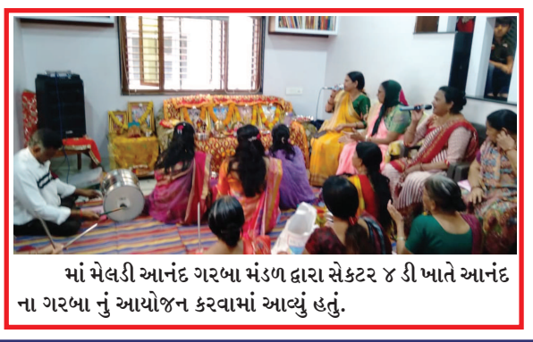
માં મેલડી આનંદ ગરબા મંડળ દ્વારા સેક્ટર ૪ ડી ખાતે આનંદ ના ગરબા નું આયોજન કરવામાં આવ્યું હતું.