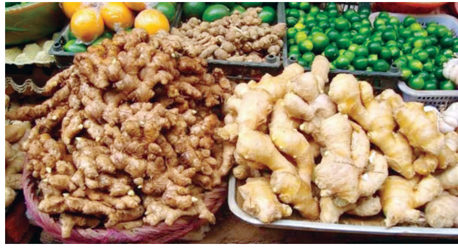
હલકી કલોવિટીના આદુનું પણ ઉંચા ભાવે વેચાણ થાય છે. વાવાઝોડા સમયે ઢૂંકાચેલા પવનના કારણે વેલામાંથી ફૂલ ખરી ગયા હતા તેમજ કેટલાક વેલાઓ તૂટી ગયા છે જેના કારણે હવે તે શાકભાજીની ઘટ વરતાઈ રહી છે આજ કારણથી અત્યારે શાકભાજીના ભાવ ગયા ચોમાસા કરતા પણ વધારે છે જે આગામી દિવસોમાં પણ યથાવત રહે તેવી પૂરી શક્યતા હોવાનું શાકભાજીના વેપારીઓ કહી રહ્યા છે. આદુના સ્વાસ્થ્યને લગતા લાભો આપણે બધા જાણીએ છીએ. આપણે આદુની ચા પીએ છીએ, આદુનો ઉકાળો

ગાંધીનગર, તા. ૪ ટામેટા બાદ હવે આદુમાં પણ રોષ જોવા મળ્યો છે. બજારમાં આદુનું ૨૦૦ થી ૩૦૦ રૂપિયામાં છૂટક વેચાણ કરવામાં આવી રહ્યું છે. મોંઘવારીની પીય પર સડી ફટકારીને લીલા મરચાં પણ ૧૫૦થી ઉપર રમે છે. આ સાથે જીરું અને હળદર પણ આકાશને સ્પર્શી રહ્યા છે. બીજી તરફ ચોમાસામાં લીલા શાકભાજીએ પણ પોતાનું વલણ ધારણ કર્યું છે. પરવળથી લઈને રીંગણ અને ભીંડાથી લઈને રીંગણ ૫૦ થી ૧૦૦ રૂપિયા પ્રતિ કિલોના ભાવે વેચાઈ રહ્યા છે. શહેરમાં ડુંગળી પણ ૬૦ રૂપિયા પ્રતિ કિલો સુધી પહોંચી ગઈ છે. સામાન્ય રીતે શિયાળામાં જ આદુના ભાવ હોય છે. આદુની કિંમતમાં ધરખમ વધારાને લીધે અદરકની ચા વેચતા ટી-સ્ટોલવાળાએ અને ઘરમાં ચામાં આદુ નાખવાની ટેવ હોય એમણે આદુના વપરાશનું પ્રમાણ ઘટાડવું પડ્યું છે. કમોસમી વરસાદ અને કેટલાક ભાગોમાં કરા પડવાથી આદુના પાકને બહુ નુકસાન થયું છે. સામાન્ય રીતે નવી મુંબઈની માર્કેટમાં નાશિક, ઔરંગાબાદ, બુલઢાણા અને યવતમાળથી મોટા પ્રમાણમાં આદુની આવક થતી હોય છે. પરંતુ આ વખતે આદુની આવક સાવ ઘટી ગઈ છે. બીજી તરફ આદુની માંગમાં સતત વધારો થતો હોવાથી કિંમત વધવા લાગી છે. ભીંજવેલા અને