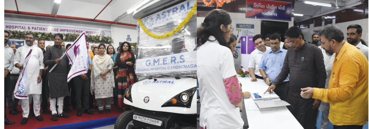
સેન્ટરમાં રાઉન્ડ ધ કલોક આ હેલ્પ ડેસ્ક કાર્યરત કરવામાં આવ્યા છે. દર્દી અને તેમના સગાઓની આ ત્રણેય ગોલ્ડકાર એક સેવાભાવી સંસ્થા દ્વારા સી.એસ.આર. અંતર્ગત જણાવ્યું કે, રાજ્ય સરકાર દ્વારા રાજ્યની સરકારી આરોગ્ય સંસ્થાઓમાં ઉપલબ્ધ સેવા અને તેમના સગાઓને હોસ્પિટલમાં ઉપલબ્ધ સેવાઓ, સુવિધાઓ અને મહત્વની તમામ

ગાંધીનગર, તા. ૦૪ આરોગ્યમંત્રીશ્રી ઋષિકેશ પટેલ દ્વારા હોસ્પિટલ અને પેશન્ટ કેર ઇમ્પ્રુવમેન્ટ મિશન હેઠળ (HPCIM) ના પાયલટ પ્રોજેક્ટનું ગાંધીનગર સિવિલ હોસ્પિટલ ખાતેથી શુભારંભ કરાવવામાં આવ્યું હતું. આ મિશન હેઠળ આરોગ્યમંત્રીશ્રીએ ગાંધીનગર સિવિલ હોસ્પિટલમાં દર્દી અને સગાઓ માટે નવનિર્મિત બે હેલ્પ ડેસ્ક અને ઝાઝળ હેઠળ મળેલ ત્રણ ગોલ્ડ કારનો શુભારંભ કરીને દર્દીઓની સેવામાં સમર્પિત કરી હતી. દર્દી - કેન્દ્રીત આરોગ્ય સારવાર અને સંભાળની સાથે હોસ્પિટલમાં ઉપલબ્ધ સેવા-સુવિધાઓની ઉપલબ્ધતા હોસ્પિટલમાં આવતા દર્દી અને તેમના સગાઓને આ હેલ્પ ડેસ્ક અંતર્ગત ૨૪૭ સરળતા થી ઉપલબ્ધ કરાવવામાં આવશે. ગોલ્ડ કારનો પણ મંત્રીશ્રી ઋષિકેશ પટેલના હસ્તે શુભારંભ કરાવવામાં આવ્યો હતો. હોસ્પિટલમાં દર્દીઓના સેવાયે આપવામાં આવી છે. મંત્રીશ્રી ઋષિકેશ પટેલે આ ત્રણેય સેવાઓને ખુલ્લી મુકતા સુવિધાઓની સરળ ઉપલબ્ધતા પર ધ્યાન કેન્દ્રિત કરવામાં આવી રહ્યું છે. હોસ્પિટલમાં આવતા દર્દી માહિતી સરળતા અને સત્વરે ઉપલબ્ધ બને તે માટે હેલ્પ ડેસ્ક તેમજ વિવિધ જનજાગૃતિની પ્રવૃત્તિઓ હોસ્પિટલમાં હાથ ધરવામાં આવી છે. પેશન્ટ કેર ઇમ્પ્રુવમેન્ટ મિશન ગાંધીનગર થી શરૂ કરાયેલ પાયલટ પ્રોજેક્ટ બાદ રાજ્યની કુલ ૯૩ જેટલી આરોગ્ય સંસ્થાઓમાં આ પ્રવૃત્તિઓ હાથ ધરવામાં આવશે. રાજ્યની ૬ સરકારી મેડિકલ કોલેજ અને હોસ્પિટલ, ૮ ડર્શઈજ મેડિકલ કોલેજ, ૨૧ જિલ્લા હોસ્પિટલ અને ૫૮ પેટા જિલ્લા હોસ્પિટલ મળીને કુલ ૯૩ જેટલી હોસ્પિટલ અને કોલેજમાં આ પ્રોજેક્ટ અંતર્ગત વિવિધ પ્રવૃત્તિઓ હાથ ધરવામાં આવનાર હોવાનું મંત્રીશ્રી ઋષિકેશ પટેલે ઉમેર્યું હતું.