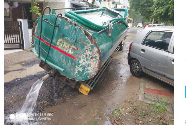
સેક્ટર ૨૨, સત્યમ સોસાયટીમાં વરસાદ બાદ રસ્તાની હાલત કફોડી બનતા ગઈકાલે એક પાણી ભરેલા ટેકરનું ટાયર ખાડામાં ફસાઈ જતાં ટેકર આખું નમી ગયું હતું. અને અવર જવર કરતા લોકો માટે નડતરરૂપ બન્યું હતું