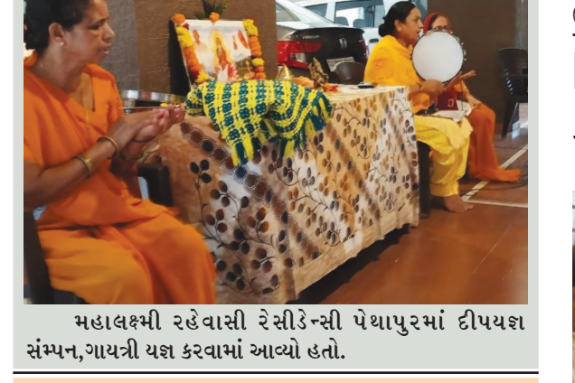
મહાલક્ષ્મી રહેવાસી રેસીડેન્સી પેથાપુરમાં દીપચણ સંમ્પન, ગાયત્રી યજ્ઞ કરવામાં આવ્યો હતો.

ગાંધીનગર, તા. ૧૦ રાષ્ટ્રીય કાનૂની સેવા સત્તા મંડળની પારા લીગલ વોલેન્ટિયર્સ સ્કીમ-૨૦૧૦ અંતર્ગત ગાંધીનગર જિલ્લા કાનૂની સેવા સત્તા મંડળ તેમજ ગાંધીનગર, કલોલ, માણસા અને દહેગામ તાલુકાની તાલુકા કાનૂની સેવા સમિતિની કચેરી ખાતે પારા લીગલ વોલેન્ટિયર્સની નિમણૂક કરવામાં આવશે. આ માટે શિક્ષકો, નિવૃત્ત શિક્ષકો, નિવૃત્ત સરકારી કર્મચારી, એમ. એસ. ડબલ્યુ. ના વિદ્યાર્થી કે શિક્ષક, આંગણવાડીના કાર્યકર, ડોક્ટર, બિન રાજકીય સભ્યો, સ્વૈચ્છિક સંસ્થાના સભ્યો તથા વુમન નેબરહુડ ગ્રુપના સભ્યો પૈકી સ્વૈચ્છિક રીતે આ કામગીરીમાં જોડાવા માગતા લોકોએ જિલ્લા કાનૂની સેવા સત્તા મંડળ, રૂમ નંબર ૧૦૧, પ્રથમ માળ, ન્યાય મંદિર, સેક્ટર-૧૧, ગાંધીનગર ખાતેથી નિયત નમૂનાનું ફોર્મ મેળવી તેમાં વિગતવાર માહિતી ભરીને આગામી તારીખ ૧૭ જુલાઈ, ૨૦૨૩ સુધીમાં પરત કરવા તેમજ વધુ માહિતી માટે મંડળનો સંપર્ક સાધવા મંડળના સચિવની યાદીમાં જણાવવાયું હતું.