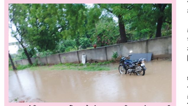
ગાંધીનગરના નવા વિસ્તારોમાં પણ વરસાદી ઋતુમાં પણ પાણી ભરાવાની સમસ્યા સર્જાઈ રહી છે. શહેરના કોબા ગામ વિસ્તાર નજીક ટીપી-૨ ખાતે દેવશ્રુત વિલા સોસાયટીમાં તથા આસપાસમાં વિસ્તારમાં વરસાદી પાણી જળબંબાકાર રીતે ભરાઈ જવા પામ્યા છે. આ વિસ્તારમાં વરસાદી પાણીના નિકાલની યોગ્ય વ્યવસ્થા ગોઠવાય તે જરૂરી જણાઈ રહ્યું છે.