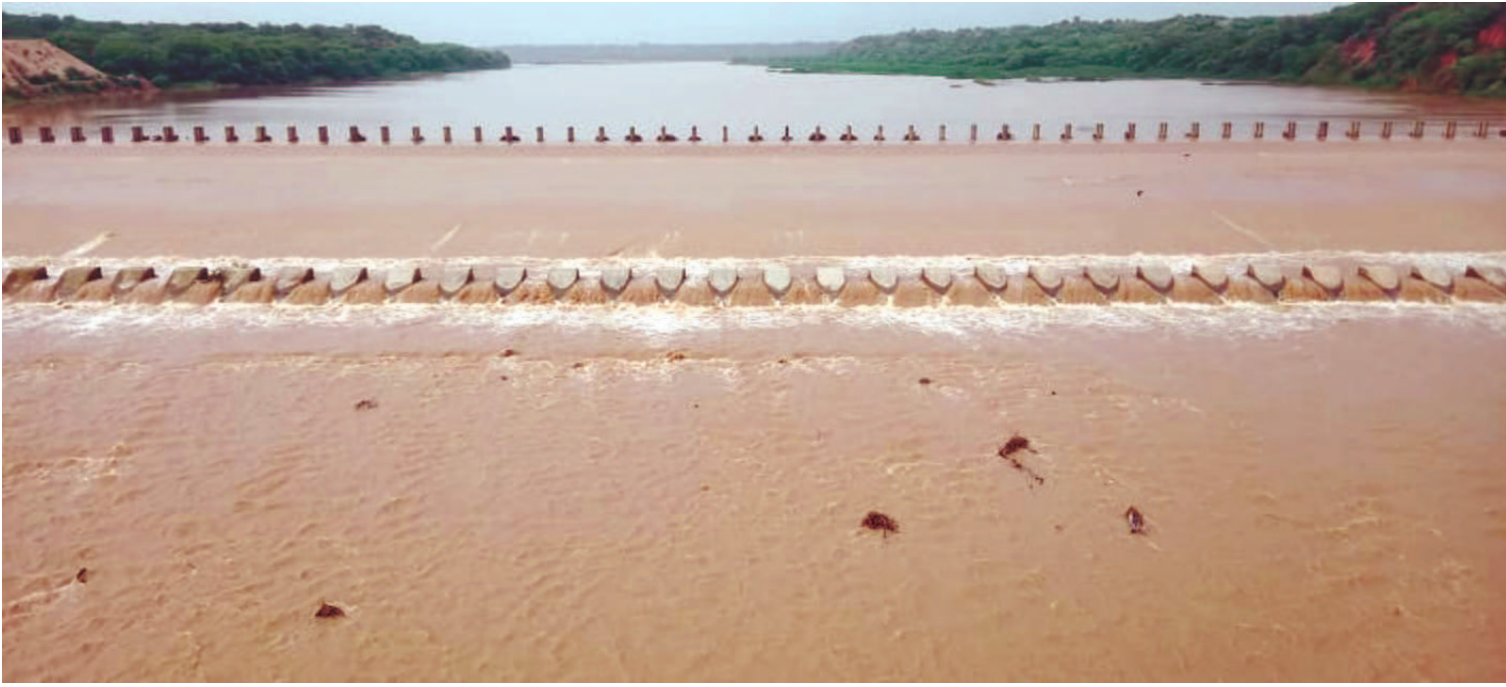
સાબરકાંઠા જિલ્લાના પ્રાંતિજના સાદોલીયા પાસે આવેલ સાબરમતી નદીમાં ઉપરવાસમાં પડેલ વરસાદને લઈને નવા નીર આવતા સાબરમતી નદી બે કાંઠે થઈ અને સાદોલીયા અને ડીયા ચેક ડેમ છલોછલ ભરાતા આવરફોલ થતા ધરતી પુત્રો સહિત પંથક ના લોકો મા પુશી જોવા મળી છે