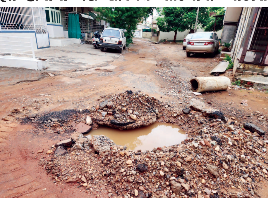
નાખ્યા પછી યોગ્ય પુરણ કરવામાં વેઠ ઉતારતાં રોડ પર કાદવ-ક્રીચડના થર જામવાની સાથે પાણી ભરાઈ રહેતા શહેરજનો તોબા પોકારી ઉઠ્યા છે મોડાસા શહેરની ભુવા નગરી માટે કોણ જવાબદાર?