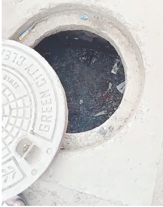
તાત્કાલિક આ સમસ્યાનું નિવારણ લાવવા તથા ભવિષ્યમાં આ પ્રકારની સમસ્યાઓ ન થાય એ કોઈ કાયમી ઉકેલ લાવે

વિપરીત બની શકે તેમ છે. અગાઉ પણ અખબારી યાદીમાં આ બાબતનું નિવારણ લાવવા જણાવવામાં આવ્યું હતું. તંત્ર દ્વારા આ વિસ્તારની સમસ્યાનું કોઈ નિવારણ લાવવામાં ન આવતા લોકો રોષે ભરાયા છે. લોકોએ ખોબલે ને ખોબલે સત્તાધારી પક્ષને વોટ આપ્યા છે જેનું આવું માહુ પરિણામ મળશે તેમ લોકોએ ત્યારે વિચાર્યું નહોતું. વિકાસની હરોળમાં આ ગાંધીનગરમાં પણ બહોળો વિકાસ થઈ રહ્યો છે પરંતુ વિકાસના ધોધમાં આ જનતા વાંક વગર હેરાન થઈ રહી છે. આ બધી બાબતોને ધ્યાને લઈને માર્ગ અને મકાન વિભાગ થી ગંભીરતા દાખવે અને કામગીરી કરાવી