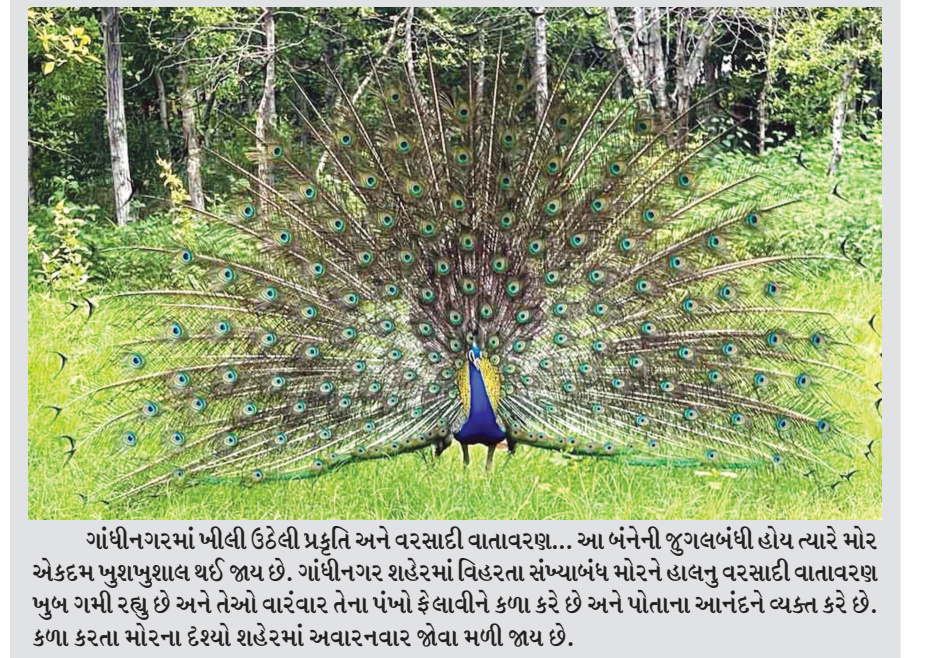
ગાંધીનગરમાં ખીલી ઉઠેલી પ્રકૃતિ અને વરસાદી વાતાવરણ... આ બંનેની જુગલબંધી હોય ત્યારે મોર એકદમ મુશ્મૂલ થઈ જાય છે. ગાંધીનગર શહેરમાં વિહરતા સંખ્યાબંધ મોરને હાલનું વરસાદી વાતાવરણ ખુબ ગમી રહ્યું છે અને તેઓ વારંવાર તેના પંખો ફેલાવીને કળા કરે છે અને પોતાના આનંદને વ્યક્ત કરે છે. કળા કરતા મોરના દૈન્યો શહેરમાં અવારનવાર જોવા મળી જાય છે.

ગાંધીનગર, તા. ૧૭ ૧૮, ૧૯, ૨૦ જુલાઈ દરમિયાન જિલ્લામાં વરસાદ થવાની હવામાન વિભાગની આગાહીને પગલે જિલ્લાતંત્ર એલર્ટ મોડમાં આવી ગયું છે. ધરોઈના જળપ્રવાહમાં થઈ રહેલા વધારાને કારણે જિલ્લાના ૪૦ જેટલા ગામોમાં સાવચેત અને સતર્ક રહેવા માટેની ચેતવણી આજે તંત્ર દ્વારા આપવામાં આવી છે. ૧૮મીના રોજ જિલ્લામાં હળવાથી મધ્યમ વરસાદની આગાહી છે જ્યારે ૧૯ અને ૨૦ જુલાઈના રોજ મધ્યમથી ભારે વરસાદ થવાની સંભાવનાઓ છે. જિલ્લામાં વરસાદના બે રાઉન્ડ થઈ ચુક્યા છે અને જિલ્લામાંથી પસાર થતી ત્રણેય નદીઓ હાલ બે કાંઠે વલી રહી છે. ગાંધીનગરમાં સંચ સરોવર પણ ૯૦ ટકા સુધી ભરાઈ જવા પામેલ છે. જિલ્લામાં વરસાદ આ વખતે બે રાઉન્ડમાં વિકમી નોંધાયો છે. જિલ્લામાં ૩૮.૫ ટકા જેટલો સિંચાણનો વરસાદ નોંધાઈ ચુક્યો છે. જિલ્લામાં થયેલા સારા વરસાદને પગલે નદીઓ અને તળાવોમાં નવા જળની આવક થઈ છે. જિલ્લામાં ભૂગર્ભજળની સપાટીમાં પણ સુધાર જોવા મળી રહ્યો છે. જિલ્લાના ચારેય તાલુકામાં વરસાદની આગાહીને પગલે તંત્ર એલર્ટ મોડમાં કામગીરી કરી રહેલ છે. જિલ્લામાં આ વખતે વીજળીઓ પડવાની ઘટનાઓ પણ વધી છે. ૧૨ જેટલા પશુઓના મોત થયા છે તેમજ ૪ જેટલા પશુઓના વીજકર્ષક લાગવાથી મોત થયા છે. જિલ્લામાં આ સિંચાણનો સૌથી વધુ વરસાદ માણસા તાલુકામાં એક જ દિવસમાં ૮ ઈંચ કરતાં વધુ નોંધાયો છે જે ઉલ્લેખનીય છે. તંત્રએ હાલ ૪૦ જેટલા નદી કિનારાના ગામોને સતર્ક અને સાવચેત રહેવા માટેની સૂચનાઓ ધરોઈમાંથી વધી રહેલ જળસપાટીને લઈ આપી દીધેલ છે.