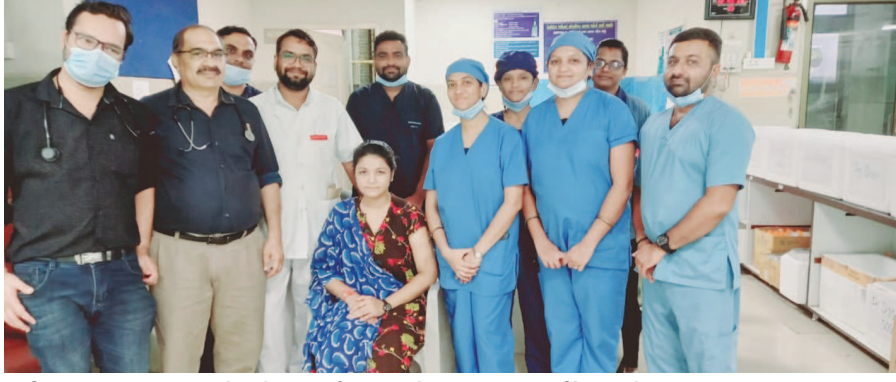
દર્દીની તબિયત વધુ લઘુત્વમાં તેણીને તા. ૨૦-૫-૨૩ થી આઈસીયુ વોર્ડમાં વધુ સઘન સારવાર માટે થઈ હતી. જેથી મહિલા દર્દીને વેન્ટીલેટર પર રાખવામાં આવી હતી. હોસ્પિટલથી પ્લાઝમા મંગાવી સારવાર આપવામાં આવી હતી. ગાંધીનગર સિવિલ હોસ્પિટલમાં

ગાંધીનગર, તા. ૧૮ ગાંધીનગર સિવિલ હોસ્પિટલના ઈનિહાસમાં સૌ પ્રથમવાર પ્લાઝમા ફેરેસીસની સારવાર બાદ ૨૮ વર્ષિય મહિલા દર્દીને મોતના મુખમાંથી ઉગારી લેવામાં આવી છે. ગાંધીનગર હોસ્પિટલના આઈસીયુ વિભાગના ડોક્ટર્સ થી લઈ તમામ સ્ટાફના કમ્પાઈઝે ૨૩ દિવસ સુધી રાત-દિવસ દર્દીની સેવા કરી છે. ત્યારે મહિલા દર્દીને નવુ જીવન મળતા તેને અને તેના પરિવારના સભ્યોએ આઈસીયુ વોર્ડના સ્ટાફના સભ્યો અને હોસ્પિટલનો આભાર વ્યક્ત કર્યો હતો. મળતી વિગત મુજબ ગાંધીનગરના સાદરા ગામની મહિલા દર્દીને ગત તા. ૧૭-૫-૨૩ ના રોજ તાવ અને ખેંચ આવવાથી સિવિલ હોસ્પિટલમાં સારવાર માટે ખસેડાયા હતા. પરંતુ મહિલા ખસેડાયા હતા. ત્યારે મહિલાની હાલત નાજુક થતા તેના મગજ, કડી અને લીવર પર અસર થઈ હતી. તેણીને લોહીના ઘટકોની તકલીફ ડાયાલીસીસ અને પ્લાઝમા ફેરેસીસની સારવાર આપવામાં આવી હતી. અમદાવાદ કિડની પ્રથમવાર અધ્યતન પ્લાઝમા ફેરેસીસની સારવાર આપી જીવન-મરણ વચ્ચે ઝોલા પાર્ટી રહેલી મહિલા દર્દીને નવજીવન આપ્યું છે. સામાન્ય તાવ અને ખેંચની બિમારીમાં એડમીટ થયેલી મહિલાની હાલત ગંભીર થઈ જતા પરિવારજનો પણ ચિંતિત બની ગયા હતા. પરંતુ આઈસીયુ વિભાગના ડોક્ટર્સ અને તમામ સ્ટાફની મહેનતથી મહિલા સ્વસ્થ બની જતા રજા આપતા ઘરે ગઈ હતી. ત્યારે તેના પરિવારજનોના ચહેરા પર અનોખી ચમક જોવા મળી હતી. જ્યારે મહિલા અને તેના પરિવારજનોએ આઈસીયુ વિભાગના તમામ ડોક્ટર્સ અને સ્ટાફનો આભાર વ્યક્ત કર્યો હતો.