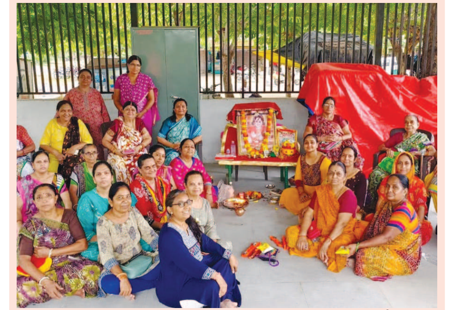
સેક્ટર-૫ સિનિયર સિટિઝન હોલમાં પરસોત્તમ માસ નિમિત્તે ભજન સહિતના વિવિધ ધાર્મિક કાર્યક્રમોનું આયોજન કરવામાં આવ્યું હતું. બ્રહ્મ સભી ભજન મંડળ દ્વારા આ કાર્યક્રમ યોજાયો હતો જેમાં મોટી સંખ્યામાં ભાવિક ભક્તો જોડાયા હતા.