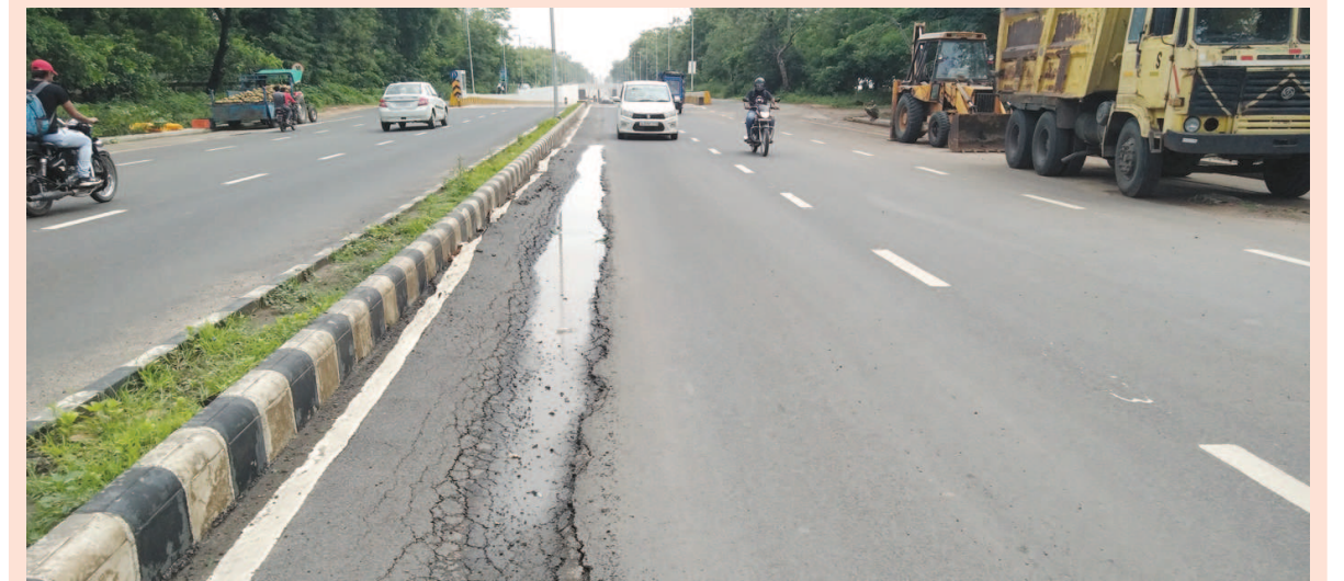
શહેરમાં હમણાં જ બનાવવામાં આવેલા અન્ડરબ્રીજ અને તેને જોડતા રસ્તાઓની હાલત બિસ્માર થઈ ગઈ છે. હજુ તો એટલો વરસાદ નથી ત્યાં અન્ડરબ્રીજમાં પાણી ભરાવાની સમસ્યા સર્જાઈ છે. આ ઉપરાંત અન્ડરબ્રીજને જોડતા રસ્તાઓ તુટી જતાં વાહનચાલકોને ખુબજ મુશ્કેલીનો અનુભવ થઈ રહ્યો છે.