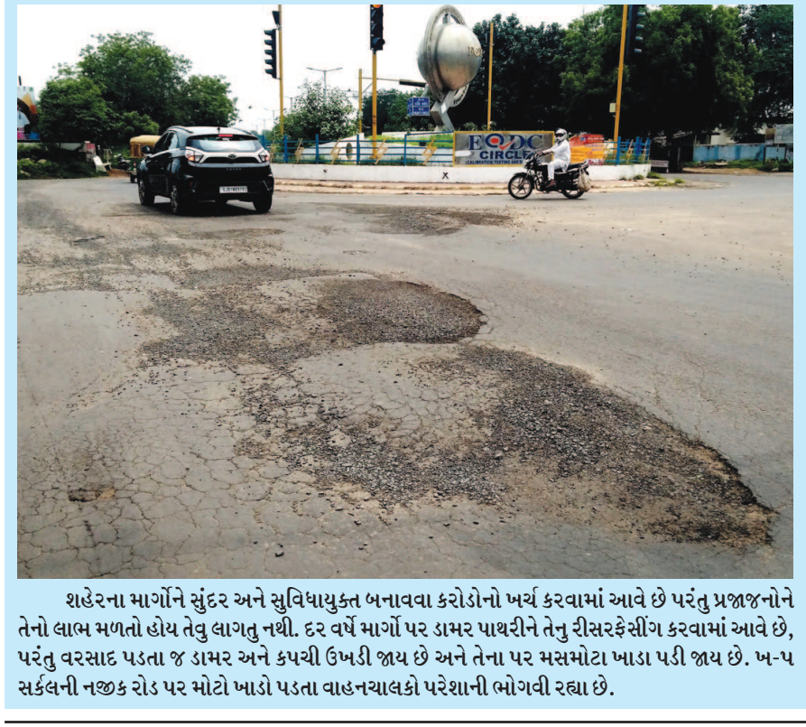
શહેરના માર્ગોને સુંદર અને સુવિધાયુક્ત બનાવવા કરોડોનો ખર્ચ કરવામાં આવે છે પરંતુ પ્રજાજનોને તેનો લાભ મળતો હોય તેવું લાગતું નથી. દર વર્ષે માર્ગો પર ડામર પાથરીને તેનું રીસરફેસીંગ કરવામાં આવે છે, પરંતુ વરસાદ પડતા જ ડામર અને કપચી ઉભરી જાય છે અને તેના પર મસમોટા ખાડા પડી જાય છે. ખ-પ સર્કલની નજીક રોડ પર મોટો ખાડો પડતા વાહનચાલકો પરેશાની ભોગવી રહ્યા છે.