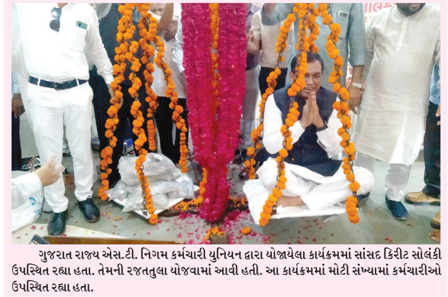
ગુજરાત રાજ્ય એસ.ટી. નિગમ કર્મચારી યુનિયન દ્વારા યોજાયેલા કાર્યક્રમમાં સાંસદ કિરીટ સોલંકી ઉપસ્થિત રહ્યા હતા. તેમની રજતુલા યોજવામાં આવી હતી. આ કાર્યક્રમમાં મોટી સંખ્યામાં કર્મચારીઓ ઉપસ્થિત રહ્યા હતા.