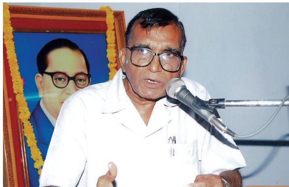
સંબંધ સજાવે જિંદગી સમીર રામી