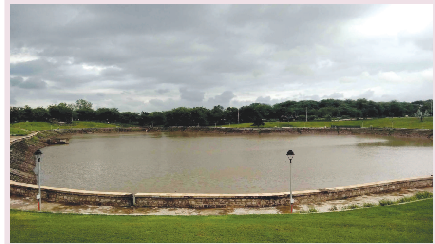
સેક્ટર-૧ ના તળાવની આસપાસનું લેન્ડ સ્કેપીંગ ખુબ અદ્ભુત છે. અહીં બાળકો માટે વિવિધ રમતના સાધનો ઉપરાંત આઉટડોર ગેમ્સ માટે મેદાન બનાવવાયા છે. જો કે અહીંની મુલાકાત લેતા મુલાકાતીઓને એક જ વાતનો વસવસો રહેતો હતો કે સેક્ટર-૧ નું તળાવ સાવ ખાલી રહે છે. તેમાં પાણી ટકતુ જ નથી. જો કે આ વર્ષે ચોમાસુ ખુબ સાડુ રહ્યું હોઈ તળાવમાં સાડુ એવું પાણી આવ્યું છે. જેના કારણે તેનો નજારો નયનરમ્ય બની ગયો છે. વરસાદી વાતાવરણને અહીં બેસીને માણવું એક આહલાદક અનુભવ છે.

સભામાં પણ આ મુદ્દે અવાજ ઉઠાવવામાં આવશે. જ્યારે મહાનગરપાલિકાના આરોગ્ય વિભાગમાં વિશેષ ભરતી પ્રક્રિયા હાથ ધરવામાં આવે છે. આ સ્થિતિમાં વિવિધ સંવર્ગના કર્મચારીઓ ભરતીના અંતે કામ મુકીને જતા રહેતા હોવાનું પણ ધ્યાને આવ્યું છે. આવા સંજોગોમાં મેન પાવરની કમી ન વર્તાય તે પણ અનિવાર્ય છે. જ્યારે ત્વરિત અસરથી અન્ય કર્મચારીઓને સમાવી શકાય તે માટે પ્રતિક્ષા યાદી મોટી રાખવા અંગેની દરખાસ્ત સંદર્ભે પણ યોગ્ય નિર્ણય કરવામાં આવશે અલબત્ત વેઈટીંગ લીસ્ટ જરૂર સામે બે ગણુ રાખવા માટે પણ આયોજન કરાશે.