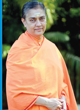
શિવમહિમ્નસ્તોત્ર પ્રવચન શ્રેણી ત્રીજો દિવસ

અધિકમાસ... તેમાં પણ અધિક શ્રાવણ માસ... એમાંય સોમવાર અને તેમાં વળી શિવમહિમ્નસ્તોત્રનો સત્સંગ સાંભળવાનો અવસર... આવો સુભગ દિવ્ય સ્મૃત્ય ભગવાન શિવની કૃપા વિના સંભવ નથી... ભગવાન શિવના ઈશ્વરત્વને સિદ્ધ કરવા માટે પુષ્પાદત્ત મહારાજ કહે