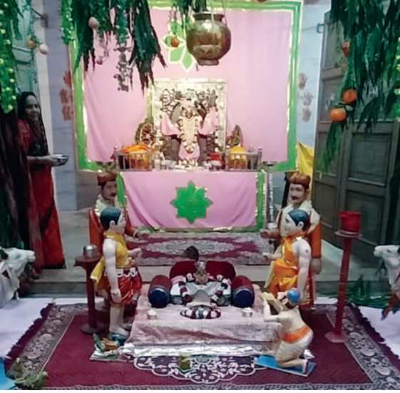
શ્રી શ્રી ગોવર્ધન નાથજી હવેલી સે-૨ ૧ ગાંધીનગર ખાતે અધિક માસ શ્રાવણ સુદ ૭ મંગળવારે માખણ ચોરી લીલા દર્શન યોજાયા હતાં.