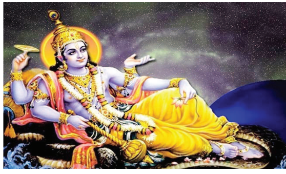
ભગવાન વિષ્ણુનું વ્રત અને પૂજા કરવાની સાથે નિયમોનું પાલન અને ત્યાગ કરવાથી ભગવાન વિષ્ણુ પ્રસન્ન થાય છે. અન્ય

વખતે ૨૮મી જુલાઈ શનિવારના રોજ થશે. આ દિવસે ભગવાન વિષ્ણુની પૂજા અને ઉપવાસ કરવાથી જ તમામ પ્રકારના પાપોનો નાશ થાય છે. આ વ્રત કરવાથી આખા વર્ષની એકાદશીનું પુણ્ય મળે છે. હિંદુ કેલેન્ડર મુજબ પુરુષોત્તમી એકાદશી વ્રત અધિક માસમાં આવે છે. જ્યારે ભગવાન વિષ્ણુના મહિનામાં આવે છે ત્યારે આ વ્રત વધુ વિશેષ બની જાય છે. આ વ્રતને શાસ્ત્રોમાં સૌથી મોટું અને મહત્ત્વનું ગણાવ્યું છે. બ્રહ્માંડ પુરાણમાં કહેવામાં આવ્યું છે કે મહામાસની એકાદશી પર