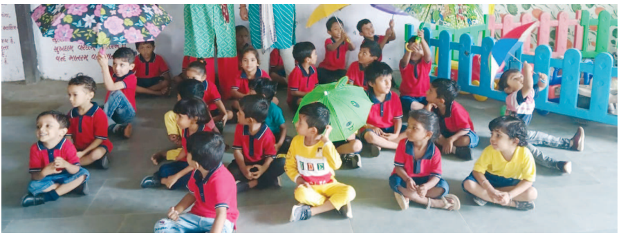
આજરોજ સ્વામી વિવેકાનંદ પબ્લિક સ્કૂલ, સેક્ટર-૨૪ ખાતે આવેલ સુપર કિડ્સ સેક્ટર-૨૪માં વરસાદી દિવસની ધમાકેદાર ઉજવણી કરવામાં આવી હતી. દરેક વિદ્યાર્થી પોતાની વિશેષ પ્રકારની છત્રી લઈને આવ્યા હતા. ઉપરાંત એ લોકોએ છત્રીના ચિત્રો દોર્યા હતા અને તેઓ પલળ્યા પણ હતા. બાલવાટિકામાં ભણતા નાના-નાના ભૂલકાઓએ ભારે આનંદ માણ્યો હતો.

જ્યાં સ્ટુડન્ટ્સ કાઉન્સિલ પ્રિકેટ તરીકે નેતૃત્વની ભૂમિકા પ્રાપ્ત કરે છે અને તેમની ફરજો નિષ્ઠાથી નિભાવવા માટે શપથ લે છે. બાળકોને જવાબદારી સોંપવી એ મહત્વપૂર્ણ કાર્ય છે. જેના દ્વારા તેઓ પણ લીડરશીપનું કૌશલ્ય શીખી શકે છે. આ કાર્યક્રમના મુખ્ય મહેમાન તરીકે વાલીઓએ હાજરી આપી હતી. સૌ પ્રથમ પરેડ દ્વારા મહેમાનને આવકારવામાં આવ્યા હતા. ત્યારબાદ દીપ પ્રાગટ્ય તથા પ્રાર્થના-સ્વાગત દ્વારા શરૂઆત કરવામાં આવી હતી. શાળાના કેપ્ટન, વાઈસ કેપ્ટન, હાઉસ કેપ્ટન, ડિસિપ્લિન ઈન્ચાર્જ, એક્ઝિવિટી ઈન્ચાર્જ, પ્રિકેટ તથા દરેક વિદ્યાર્થીઓએ શપથ લીધા હતા. શાળાના પ્રિન્સિપાલ તથા શિક્ષકોએ વિદ્યાર્થીઓને તેમની ફરજો તથા માર્ગદર્શન પુરૂ પાડ્યું હતું.