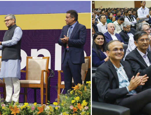
સેમિકોન ઈન્ડિયા સમિટમાં ભારતમાં સેમિકંડક્ટર ક્ષેત્રે રોકાણ