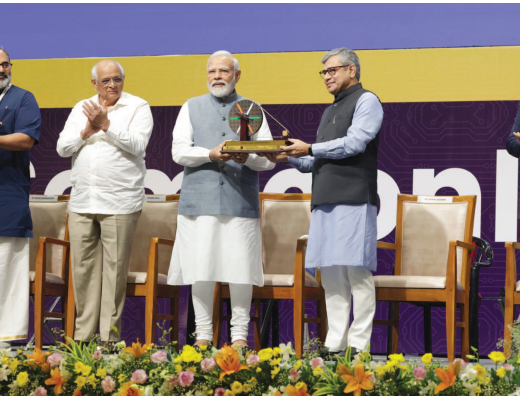
કંપનીઓના વડાઓ તેમજ પ્રતિનિધિઓને આવકારતા