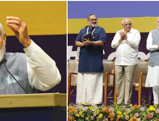
ભરોસો મૂકનારાઓને આ દેશ ક્યારેય નિરાશ કરતો નથી.