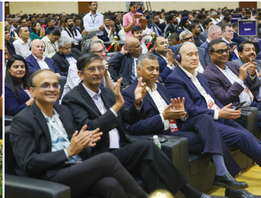
વર્ષ પછી ભારતીય યુવાનોની મહત્વાકાંક્ષાઓના પરિણામ

માટે ન કરવું? એ પ્રશ્ન પર ચિંતન કરવામાં આવી રહ્યું છે.