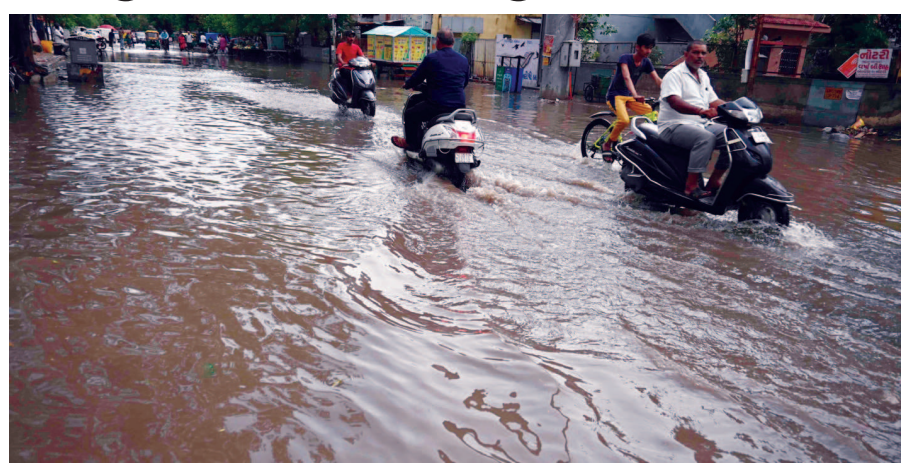
ઘડી તો રસ્તા પરથી વિઝિબલિટી પણ ઓછી થઈ ગઈ હતી. એટલું જ નહીં વાહન ચાલકોને પણ હાલાકીનો સામનો કરવો પડ્યો

અમદાવાદ, તા.૪ સાયકલોનિક સર્ક્યુલેશનના કારણે રાજ્યના કેટલાક વિસ્તારોમાં પાંચ દિવસ દરમિયાન ધોધમાર વરસાદ પડવાની આગાહી કરવામાં આવી છે. આની સીધી અસર અમદાવાદ શહેર પર પણ જોવા મળી રહી છે. જેમાં રવિવારે વહેલી સવારથી જ આકાશમાં કાળા ડિબાંગ વાદળો ઘેરાઈ ગયા હતા. આ દરમિયાન વીજળીના કડાકા સાથે ભારે પવન ફૂંકાવાનું શરૂ થઈ ગયું હતું. તેવામાં ગણતરીની સેકન્ડોમાં અનરાધાર વરસાદ પડતા વાતાવરણમાં ઠંડક પ્રસરી ગઈ હતી. અમદાવાદમાં જે પ્રમાણે વરસાદ પડ્યો એનાથી બે