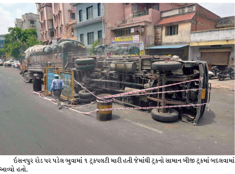
ઈસનપુર રોડ પર પડેલ ભુવામાં ૧ ટ્રકપલટી મારી હતી જેમાંથી ટ્રકનો સામાન બીજા ટ્રકમાં બદલવામાં આવ્યો હતો.