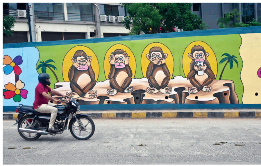
સરખેજ મકરબા રેલવે અંડરબ્રિજમાં દોરેલ પેન્ટીંગમાં ગાંધીજીના ૩ બંદરમાં એકનો ઉમેરો થયો છે. જેમાં બંદરના હાથમાં મોબાઈલ રાખવામાં આવેલ છે.

અમદાવાદ, તા. ૨૫ જમાલપુર વિસ્તારમાં ગેરસમજણના કારણે સર્જાયેલ વિવાદે ઉગ્ર સ્વરૂપ ધારણ કર્યું અને રાત સુધીમાં આગચંપીની ઘટના બની. જેના કારણે આસપાસના વિસ્તારમાં ભયનો માહોલ સર્જાઈ ગયો. કિન્નરો અને સ્થાનિક લોકો વચ્ચે થયેલ ઘર્ષણ મામલે બંને પક્ષે સામ સામે પોલીસ ફરિયાદ થઈ, જે મામલે પોલીસે કુલ ૧૬ આરોપીની ધરપકડ કરી છે. સાથે જ પોલીસ પ્રશાસન દ્વારા એ પણ સ્પષ્ટતા કરવામાં આવી છે કે આ