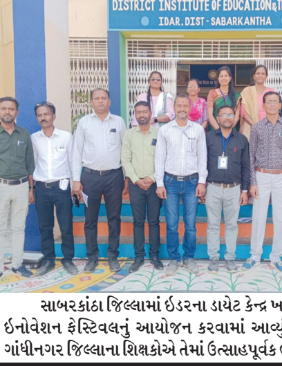
સાબરકાંઠા જિલ્લામાં ઈડરના ડાયેટ કેન્દ્ર ખાતે રાજ્યકક્ષાનો ઈનોવેશન ફેસ્ટિવલનું આયોજન કરવામાં આવ્યું છે. આ પ્રસંગે ગાંધીનગર જિલ્લાના શિક્ષકોએ તેમાં ઉત્સાહપૂર્વક ભાગ લીધો હતો.

બંને ગ્રહો નજીક આવવાની અલૌકિક ઘટના શુક્ર એ આકાશમાં સૌથી તેજસ્વી ગ્રહ છે, શુક્ર, સૌરમંડળનો બીજો પૃથ્વીની સૌથી નજીકનો ગ્રહ છે. નાસાના જણાવ્યા અનુસાર શુક્ર પૃથ્વી ગ્રહથી ૨૬૧ મિલિયન કિમી દૂર છે. શુક્ર સુર્યની આસપાસ ફરવા માટે ૨૨૪.૭ પૃથ્વી દિવસ લે છે. જ્યારે ગ્રહો એકબીજાને પકડે છે ત્યારે તે દર ૫૮૪ દિવસમાં (લગભગ દર ૧૯ મહિને) એક વખત પૃથ્વીની નજીક આવે છે. સરેરાશ, આ બિંદુએ તે ૪૦ મિલિયન કિમી દૂર છે, જો કે તે ૩૮ મિલિયન કિમી જેટલું નજીક પહોંચી શકે છે. ગુરુ એ ગ્રહોનો રાજા છે અને ચંદ્રનો રાજા પણ છે (૮૨ ચંદ્ર), અને સુર્યમંડળનો પાંચમો ગ્રહ, ગુરુ, તેના અંતર હોવા છતાં આકાશમાં તેજસ્વી રીતે ચમકે છે. ગુરુ પૃથ્વીથી લગભગ ૯૯૮ મિલિયન કિમી દૂર છે. જ્યારે તે પૃથ્વીની નજીક છે, ત્યારે તે લગભગ ૫૮૮ મિલિયન કિલોમીટર દૂર છે. ગુરુ સુર્યની એક ભ્રમણકક્ષા પૂર્ણ કરવામાં ૧૧.૮૬ પૃથ્વી-વર્ષ લે છે. જેમ જેમ પૃથ્વી સુર્યની આસપાસ ફરે છે, તે દર ૩૯૬ દિવસમાં એકવાર (લગભગ ૧૩ મહિનામાં) ગુરુ સાથે મળે છે. આ રીતે, જ્યારે બંને ગ્રહો પૃથ્વીની નજીક આવશે, ત્યારે તેઓ એકબીજાથી લગભગ ૬૨૮ મિલિયન કિમી દૂર હશે.