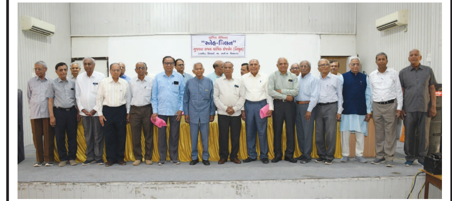
ગુજરાત સરકારશ્રીના જળસંપતિ, નર્મદા નિગમ અને માર્ગ-મકાન વિભાગના નિવૃત્ત યાંત્રિક ઈજનેરો નો વાર્ષિક રનેહ મિલન સમારંભ તા ૨૬ ફેબ્રુઆરી ના રોજ સ્ટાક ટ્રેનિંગ કોલેજ, ગાંધીનગર ના ઓડીટોરીયમ ખાતે યોજાવામાં આવ્યો હતો જેમાં સરદાર સરોવર નર્મદા નિગમ લિમિટેડ ના મુખ્ય ઈજનેરશ્રી એ. એફ. ભોરાનીયાએ મુખ્ય મહેમાન તરીકે પ્રાર્થનિક પ્રવચન કર્યું હતું તેમજ નિવૃત્ત યાંત્રિક ઈજનેરો દ્વારા સમાજમાં ઉપયોગી હોય તેવા સૂચનો આપવા માટે આભાન આપ્યું હતું. આ પ્રસંગે ૭૫ વર્ષથી વધુ વયના ઈજનેર વડીલોનું શાલ ઓઢાડીને સન્માન કરવામાં આવ્યું હતું.

ગાંધીનગર, તા. ૦૧ ગાંધીનગરના પાલજ ખાતેની ઈન્ડિયન ઈન્સ્ટિટ્યૂટ ઓફ ટેકનોલોજી (આઈઆઈટી ગાંધીનગર) માં આજે ?? તેના કેમ્પસમાં શાળા અને કોલેજના વિદ્યાર્થીઓ માટે ઘણી રોમાંચક અને હાથ પરની પ્રવૃત્તિઓ અને વૈજ્ઞાનિક પ્રદર્શનો સાથે 'ઓપન ડે'નું આયોજન કરીને 'રાષ્ટ્રીય વિજ્ઞાન દિવસ'ની ઉજવણી કરી હતી. અમદાવાદ, ગાંધીનગર અને નજીકના જિલ્લાઓમાંથી ૧૫ શાળાઓના ૧૦૦૦ જેટલા વિદ્યાર્થીઓ અને ઉચ્ચ શિક્ષણ સંસ્થાઓ-યુનિવર્સિટીઓના ૨૦૦ કોલેજના વિદ્યાર્થીઓએ વિજ્ઞાન અને તેની અજાયબીઓનું અન્વેષણ કરવા, અનુભવ કરવા અને માણવા માટે આઈઆઈટી ગાંધીનગર કેમ્પસની મુલાકાત લીધી હતી. અ? પ્રસંગે આઈઆઈટી ગાંધીનગરે રોયલ સો સાયટી ઓફ કેમિસ્ટ્રીના સમર્થન સાથે, જીઈર (સાયન્સ, ટેકનોલોજી, એન્જિનિયરિંગ અને ગણિત)ના શિક્ષણને લોકપ્રિય બનાવવા અને તેમને જીઈરના વિવિધ ક્ષેત્રોમાં કારકિર્દી બનાવવા માટે પ્રેરણા આપવાના ઉદ્દેશ્ય સાથે મુલાકાત લેતા વિદ્યાર્થીઓ માટે ઘણી રોમાંચક પ્રવૃત્તિઓ અને વૈજ્ઞાનિક પ્રદર્શનોનું આયોજન કર્યું હતું. ્રના અંડરગ્રેજ્યુએટ, અનુસ્નાતક અને પીએચડી વિદ્યાર્થીઓ દ્વારા કરવામાં આવેલા પ્રદર્શનોએ વિવિધ વૈજ્ઞાનિક પ્થાલોને રસપ્રદ અને મનોરંજક રીતે સમજાવ્યા હતાં.