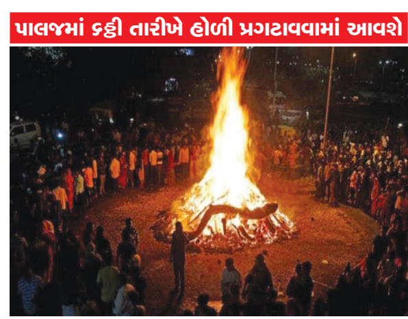
પાલજમાં કઢી તારીખે હોળી પ્રગટાવવામાં આવશે

વાગ્યા સુધી જ પૂર્ણિમા છે. જ્યારે હોળીનો નિયમ છે કે નિશાકાળમાં જ પ્રગટાવવામાં આવે ત્યારે તારીખ ઇમીના નિશાકાળ સુધી પૂર્ણિમા તિથિ પહોંચતી નથી. માટે શાસ્ત્ર અનુસાર તારીખ ૬ ના રોજ હોળી પ્રગટાવવી જ્યારે ઉદયતિથિના નિયમને અનુસરતા હો તો તારીખ ઇમીના પછા હોળી પ્રગટાવી શકાય છે. શાસ્ત્રમાં નિશાકાળમાં જ હોળી પ્રગટાવવાનું જણાવાયું છે અને ઉલ્લેખ પણ કરાયો છે. તેમાં હોલિકાદહન નિશાકાળમાં કરવું જોઈએ. દિવસમાં હોલિકાદહન અથવા હોલિકા પૂજન ન કરાય. હોલિકાદહનની પૂજા સમયે મુખ પૂર્વ કે ઉત્તર દિશામાં હોવું જોઈએ. હોલિકાદહન