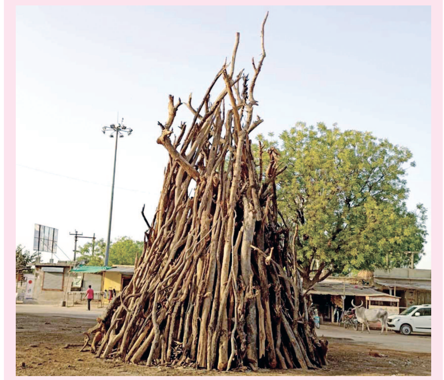
ગાંધીનગર નજીક આવેલા પાલજ ગામની હોળી ખૂબ વિખ્યાત છે. હોળી નજીક આવી રહી હોવાથી પાલજ ગામમાં તેની તૈયારીઓ પણ શરૂ થઈ ચૂકી છે. આસપાસના ગ્રામજનો પણ તેયારીમાં જોડાયા છે.