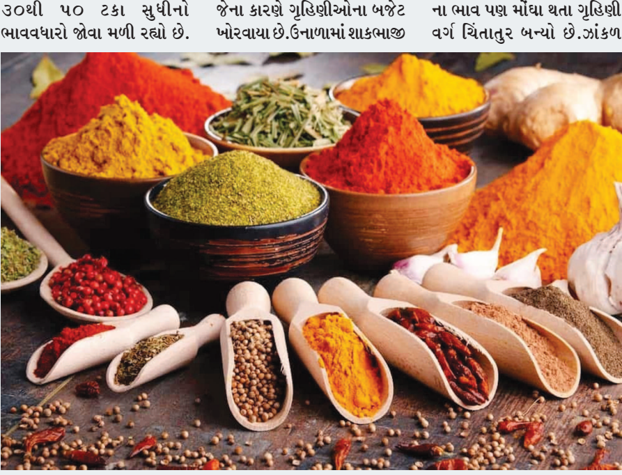
૩૦થી ૫૦ ટકા સુધીનો ભાવવધારો જોવા મળી રહ્યો છે. જેના કારણે ગૃહિણીઓના બજેટ ખોરવાયા છે. ઉનાળામાં શાકભાજી ના ભાવ પણ મોંઘા થતા ગૃહિણી વર્ગ ચિંતાતુર બન્યો છે. ઝાંકળ

ગાંધી.તા.૧૯ ઉનાળાની શરૂઆત થતાં જ લોકો આખા વર્ષના મસાલા ભરતા હોય છે. ગૃહિણીઓ મરચું, હળદર, ઘણાજીરું દળાવવા મસાલા માર્કેટ પહોંચે છે અને આખા વર્ષના મસાલા ભરે છે. પરંતુ આ વર્ષે મસાલા માર્કેટમાં દર વર્ષ જેટલી તેજ નથી દેખાઈ રહી. મસાલાના ભાવમાં ધરખમ વધારો થયો હોવાથી માર્કેટમાં સનકારો છવાઈ ગયો છે. મોંઘવારીના મારથી ગરીબ અને મધ્યમ વર્ગ પીડાઈ રહ્યો છે, ત્યારે મરચું અને જીરા સહિત મસાલાના પણ ભાવમાં અસહ્ય ઉછાળો આવતા બારમાસી મસાલો ભરતા લોકોની હાલત કફોડી બની છે. અત્યારે બારમાસી મસાલો ભરવાની સિઝન ચાલી રહી છે. પરંતુ આ વર્ષે મરચું અને જીરામાં ગત વર્ષ કરતા