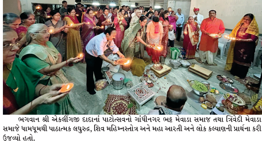
ભગવાન શ્રી એકલીંગજી દાદાનાં પાટોત્સવનો ગાંધીનગર ભટ્ટ મેવાડા સમાજ તથા ત્રિવેદી મેવાડા સમાજે ધામધૂમથી પાઠાત્મક લઘુરુદ્ર, શિવ મહિમસ્તોત્ર અને મહા આરતી અને લોક કલ્યાણની પ્રાર્થના કરી ઉજવ્યો હતો.