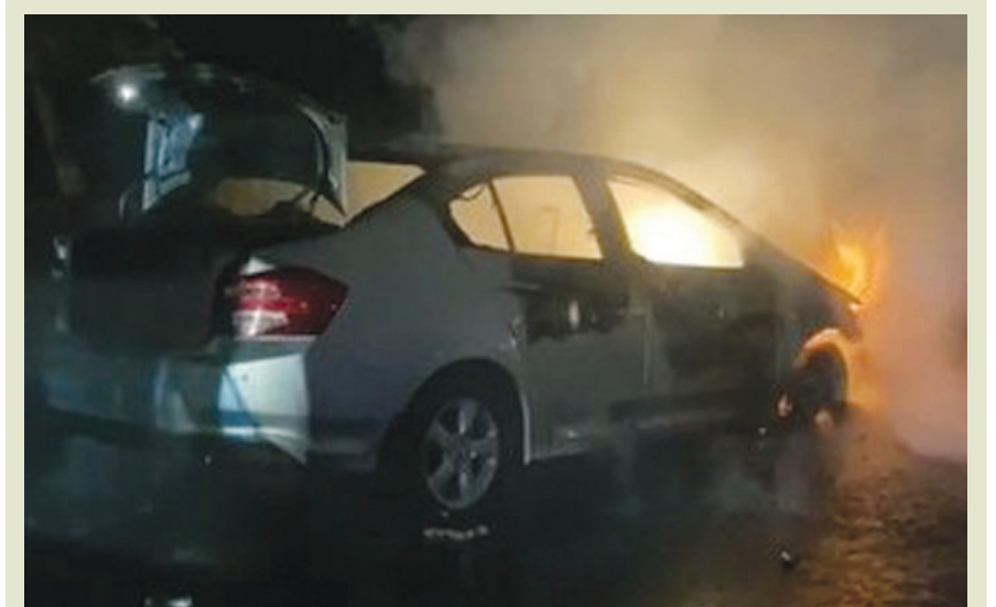
ગાંધીનગર નજીક સરગાસણ-તારાપુર વચ્ચે ગઈકાલે રાત્રીના સમયે હોન્ડા સીટી કારમાં આગ ભભુકી ઉઠી હતી. આગની જવાબોમાં કાર બળીને રાખ થઈ હતી. જ્યારે આ બનાવમાં કાર ચાલકનો આબાદ બચાવ થયો હતો. બનાવની જાણ થતા ફાયર ટીમના જવાનોએ પહોંચી જઈ પાણીનો મારો ચલાવી આગ પર કાબુ મેળવી લીધો હતો. કારમાં આગ શોર્ટસર્કિટથી લાગી હોવાનું પ્રાથમિક તપાસમાં ધ્યાને આવ્યું છે. જો કે આગને પગલે અન્ય વાહન ચાલકો પણ માર્ગ પર ઉભા રહી જતા ટ્રાફિક જામના દ્રશ્યો જોવા મળ્યા હતા.