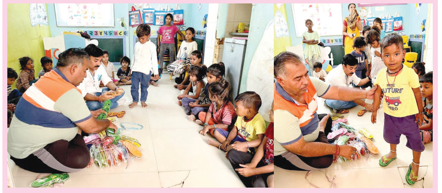
ઉનાળાની આકરી ગરમીમાં ખુલ્લા પગે રહેવા મજબૂર બાળકોને બહારે સેવા સંસ્થાઓ આવી છે. જલીયાણા સેવા શુપ દ્વારા સેક્ટર-૨૦ની આંગણવાડીના બાળકોને પગરખાંનું વિતરણ કરવામાં આવ્યું હતું.

ગાંધીનગરના વાવોલ ગામ સ્થિત વારાહી મંદિર પાછળ ગદુલ પાન પાર્લર નજીક ખુલ્લી જગ્યામાંથી એકટીવાની ચોરી થવા પામી છે. યુવકે એકટીવા ચોરી અંગે પોલીસ મથકે ફરીયાદ નોંધાવી છે.