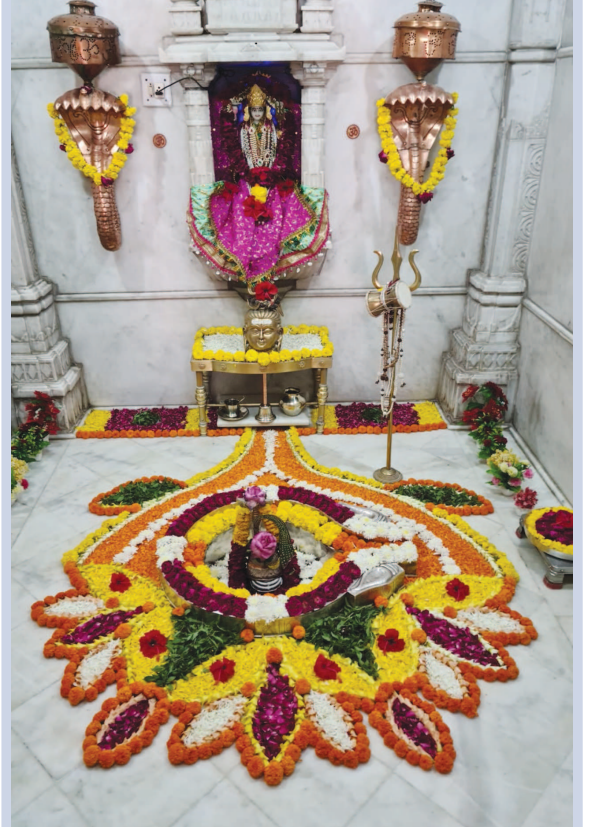
ધોળેશ્વર મહાદેવ મંદિર માં સોમવારે સુંદર ફૂલોનો શણગાર કરવામાં આવ્યો હતો. ભોલેનાથ ના દર્શનાર્થે સોમવારે શ્રદ્ધાળુઓ ની સંખ્યા પણ વધારે હતી. ભાવિકો એ સોમવારે ભગવાન ભોલેનાથ ના દર્શન કરીને ધન્યતા અનુભવી હતી.

ગાંધીનગર, તા. ૦૧ ગાંધીનગરના વિવિધ વિસ્તારમાં દબાણનો પ્રશ્ન પેથિદો બનતો જાય છે, તાજેતરમાં દબાણ ટીમ દ્વારા શહેરના કુડાસણ વિસ્તારમાં દબાણો હટાવવાની અસરકારક કામગીરી હાથ ધરાઈ હતી. શહેરના "ક" માર્ગ પર ડી-માર્ટ આસપાસ પણ દબાણોને રાફડો ફાટ્યો છે અને ગેઝીયા જીઆઈડીસીના પ્રવેશદારોની આગળ કોર્નર પર જ દબાણો હોવાથી આવતા-જતાં લોડીંગ વાહનચાલકોને પણ મુશ્કેલી પડી રહી છે. અંહી રોડની નજીક દબાણો હટાવવા તેવી લાગણી દબાણો હોવાથી ગ્રાહકો રોડ રોડ પર જ તેમના વાહનો પાર્ક કરતાં હોવાને કારણે અકસ્માતનો ભય સેવાઈ રહ્યો છે.