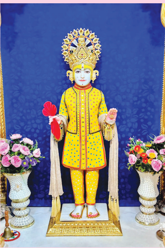
શ્રી સ્વામિનારાયણ ગાદી સંસ્થાના શ્રી સ્વામિનારાયણ મંદિર, મહિનગરમાં બિરાજમાન શ્રી ધનશ્યામ મહારાજને વેશાખ સુદ એકાદશી - મોહિની એકાદશીએ ચંદનના મનોરમ્ય કલાત્મક શણગાર કરવામાં આવ્યો છે.