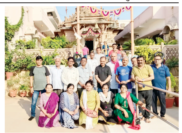
વેશાખી પૂનમે જય અંબે પરિવાર ટ્રસ્ટ - ગાંધીનગરની શક્તિ ચોક, સેક્ટર - ૧૩/બીથી ધોળેશ્વર મહાદેવની પદયાત્રા નીકળી હતી. જેમાં મોટી સંખ્યામાં શ્રદ્ધાળુઓ જોડાયા હતા.

ગાંધીનગર, તા. ૫ જિલ્લા રોજગાર વિનિમય કચેરી/મોડલ કેરિયર સેન્ટર ગાંધીનગર દ્વારા તા.૦૮ મેના રોજ એચઆર ભરતી ઓફીસ, અરવિંદ લીમીટેડ, ખાત્રજ ચોકડી પાસે તા.કલોલ, જિ. ગાંધીનગર તથા ૦૮ મેના રોજ ડી-માર્ટ (એવન્યુ સુપર માર્ટ), કોમા શોરૂમ પાસે, આસ્થા હોસ્પિટલની સામે સરગાસણ, ગાંધીનગર ખાતે સવારે ૧૦:૦૦ કલાકે ઓઘોગિક રોજગાર ભરતીમેળાનું આયોજન કરવામાં આવેલ છે. જ્યાં સ્વરોજગાર લક્ષી યોજનાઓની માહિતીનો લાભ લઈ શકાશે. જેમાં ધોરણ-૧૦ અને ૧૨ પાસ, ગ્રેજ્યુએટ, આઈ.ટી.આઈ કરેલ ઉમેદવારો ભાગ લઈ શકશે. રોજગારવાનું યુવાનો વિવિધ રોજગારીની તકોથી વંચિત ન રહે તથા નોકરીદાતાઓને રોજગાર કચેરી દ્વારા સતત કુશળ માનવબળ પ્રાપ્ત થઈ શકે તે હેતુસર રોજગાર ભરતીમેળાનું આયોજન થનાર છે.