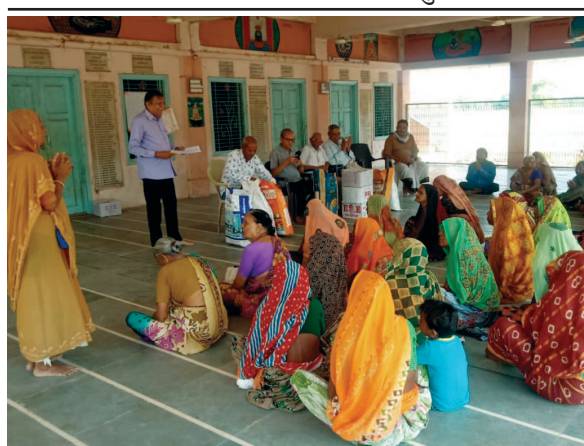
માનવ સેવા મંડળ, ગાંધીનગર દ્વારા વેશાખી પૂનમ, બુદ્ધ પૂર્ણિમા નિમિત્તે અંતરેશ્વર મહાદેવ, ઉવારસદ ખાતે અનાથ, નિરાધાર કુટુંબોને ગોળ, ઘઉં, ચોખા, મગની દાળ, ચણાની દાળ, મીઠું વગેરે કરિયાણાની ચીજવસ્તુઓનું વિતરણ કરવામાં આવ્યું હતું.

ગાંધીનગર, તા. ૫ ગાંધીનગર કુડાસણ સ્થિત "સારથિ રાયફલ એકેડમી" ખાતે તારીખ ૧૩-૧૪ મેના બે દિવસીય રાયફલ શુટિંગ પ્રાથમિક શિબિરનું આયોજન કરવામાં આવ્યું છે. આ શિબિર ફક્ત મહિલાઓ માટે જ રાખવામાં આવી છે. જ્યાં બાર વર્ષની વયુ ઉંમરના કોઈ પણ મહિલાઓ ભાગ લઈ શકે છે. ગાંધીનગરની સર્વ પ્રથમ હિન્દી વેબ ન્યુઝ ચેનલ તસવીરે ગાંધીનગર તેમજ "ઈન્ડુમતી ફાઉન્ડેશન" અને "સારથી રાયફલ શુટિંગ એકેડેમી" ના સહયોગથી સતત બીજા વર્ષે આયોજિત રાયફલ શુટિંગ પ્રાથમિક શિબિરની સમય મર્યાદા એક - એક કલાકનો રહેશે. આ તાલીમ શિબિરમાં ભાગ લેવા તેમજ વધુ માહિતી ૮૪૦૧૦ ૮૮૬૭૭ પર સંપર્ક કરવા આયોજકો દ્વારા જણાવવામાં આવ્યું છે.