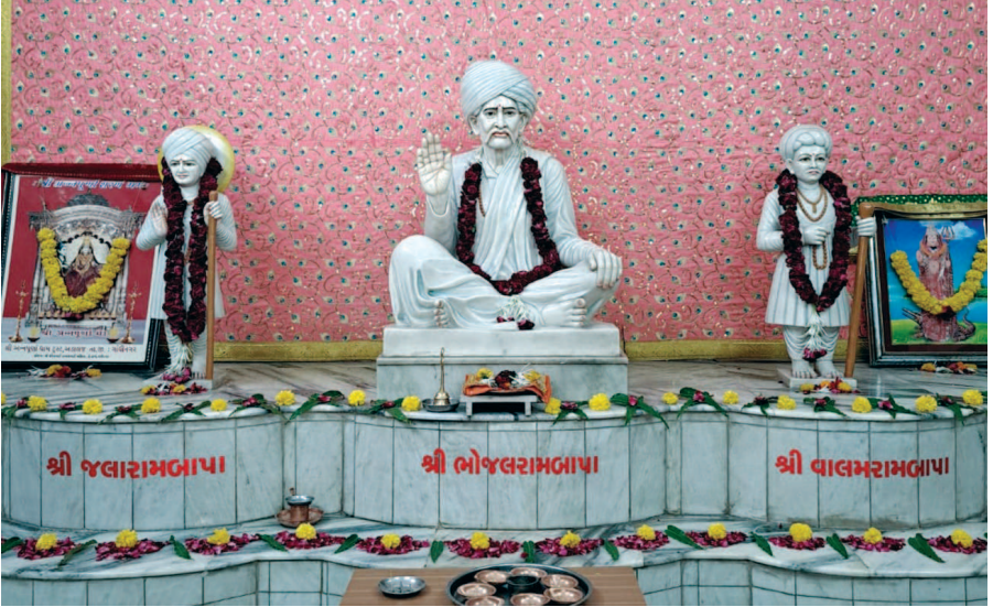
સૌરાષ્ટ્ર હેલ્પલાઈન સેવા સમાજ, ગાંધીનગર પરિસરમાં આવેલ શીખરબંધ મંદિરમાં બિરાજમાન સદગુરુ સંત શ્રી ભોજલરામ બાપાની ૨૩૮મી જન્મજયંતિ વેશાખ સુદ પૂનમના દિવસને ધામધૂમથી ઉજવણી કરવામાં આવી હતી. બપોરે ૪ થી ૬:૩૦ કલાકે ગાયત્રી યજ્ઞ કરવામાં આવ્યો હતો.