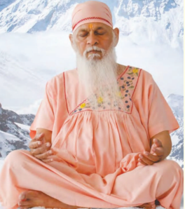
ધ્યાન કર્યા પછી વ્યક્તિના શરીરમાં થતા સકારાત્મક પરિવર્તનોને સ્વીકારે છે. સામૂહિક ધ્યાનથી ઘણા લાભ થાય છે. જે લાભ હજાર

ગાંધીનગર, તા. ૫ વર્તમાન સમયમાં દરેક વ્યક્તિ તણાવમાં જીવી રહી છે. આવા તણાવપૂર્ણ, સ્પર્ધાત્મક યુગમાં ધ્યાનનું ઘણું જ મહત્વ છે. સામાન્ય રીતે, સામાન્ય માણસને ધ્યાન કરવું મુશ્કેલ લાગે છે. તે વિચારે છે કે ધ્યાન ઘડપણમાં કરવાની વસ્તુ છે. પરંતુ હિમાલયના મહર્ષિ સદ્ગુરુ શ્રી શિવકૃપાનંદ સ્વામીજી બાળકોથી લઈને વડીલો સુધી સદા ધ્યાન કરીને જીવનમાં આત્મશાંતિ પ્રાપ્ત કરવાનો સંદેશ આપી રહ્યા છે. પૂજ્ય સ્વામીજી દ્વારા સમાજને એવા સરળ ધ્યાન સંસ્કાર ઉપલબ્ધ છે કે કોઈપણ વ્યક્તિ ખૂબ જ સરળ રીતે ધ્યાનના ક્ષેત્રમાં જઈ શકે છે, જે સમગ્ર વિશ્વમાં પ્રચલિત છે. આ ધ્યાનયોગનો અભ્યાસ કરીને વ્યક્તિ પોતાના જીવનમાં શારીરિક સ્વાસ્થ્ય, માનસિક શાંતિ, સંવાદિતા અને મોક્ષ પ્રાપ્ત કરવાનું અંતિમ લક્ષ્ય પ્રાપ્ત કરી શકે છે. આજે ઘણા વૈજ્ઞાનિક પ્રયોગો પણ સામૂહિકતામાં ધ્યાન કરવાની તક ગુમાવવી ન જોઈએ. પરમાત્મારૂપી સદ્ગુરુના સાંનિધ્યમાં, પૂર્ણમાના દિવસે હજારોની સામૂહિકતામાં ધ્યાન કરવાની આવી સુવર્ણ તક જીવનમાં મળવી ખૂબ જ દુર્લભ હોય છે. આવી જ એક સુવર્ણ તક આપણા જીવનમાં આવી રહી છે. ૭ મે, ૨૦૨૩ રવિવારના રોજ સાંજે ૭ કલાકે ગુજરાત સમર્પણ આશ્રમ, મહુડી અનોડિયા, માણસા ખાતે પૂજ્ય સ્વામીજીના સાંનિધ્યમાં નિ:શુલ્ક મહાધ્યાન દર્શન શિબિરનું આયોજન કરવામાં આવ્યું છે.