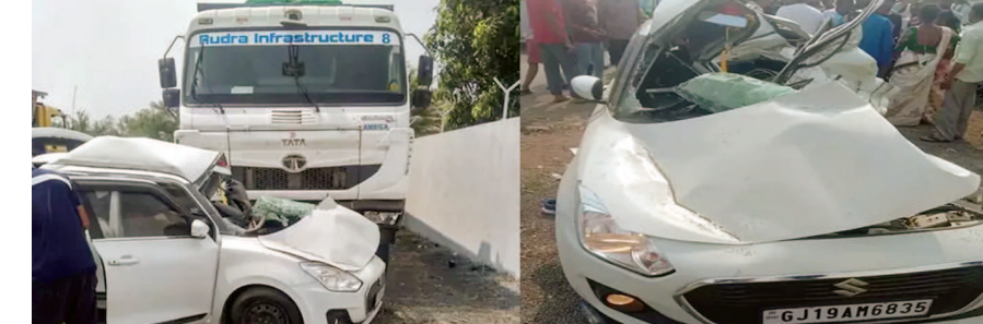
બારડોલીના બમરાં લી નજીક ગમખવાર અકસ્માત સર્જાયો છે. મળતી માહિતી મુજબ કાર અને ડમ્પર વચ્ચે અકસ્માત સર્જાયો હતો. અકસ્માત એટલો ભયાનક હતો કે કારનો ભુક્કો બોલી ગયો હતો બીજી તરફ આ ઘટનામાં ૩ મહિલા, એક પુરુષ, ૧ બાળકી અને એક બાળક સહિત ૬ લોકોના મોત થયા હોવાની માહિતી હાલ સામે આવી રહી છે. સુતક પરિવાર સુરત જિલ્લાના માંડવી ખાતે રહેતું હોવાની માહિતી સામે આવી રહી છે. બીજી તરફ પરિવાર તરસારી ખાતે લગ્ન પ્રસંગમાં ગયો હતો.

સુરત જિલ્લાના બારડોલી નજીક ગમખવાર અકસ્માત સર્જાયો છે બારડોલીના બમરાં લી નજીક કાર અને ડમ્પર વચ્ચે અકસ્માત સર્જતા ૬ લોકોના મોત થયા હોવાની માહિતી સામે હાલ સામે આવી રહી છે. અકસ્માતમાં કારનો કચ્છર ઘણી વળી ગયો હતો બીજી તરફ બનાવની જાણ થતાં પોલીસ કાફલો ઘટના સ્થળે પહોંચ્યો છે અને તપાસનો ધમધમ શરૂ કર્યો છે. સુરત શહેર અને જિલ્લામાં ઇશવારે અકસ્માતના બનાવો સામે આવી રહ્યા છે ત્યારે વધુ એક બનાવ સામે આવ્યો છે.