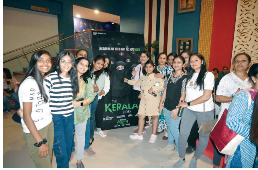
એસજી હાઈવે પરના એક થિયેટરમાં કેરાલા ફિલ્મ જોવા માટે લોકો ઉમટી પડ્યા હતા.

ઉમેદવારોને કોઈ તકલીફ ન પડે તે માટે રહેવા-જમવાની વ્યવસ્થા કરાઈ છે. સાઈદના સાધના ફાઉન્ડેશન દ્વારા સાઈદમાં રહેવા અને જમવાની વ્યવસ્થા કરવામાં આવી છે. ઉપરાંત કેટલાંક પરીક્ષા કેન્દ્ર પર પણ ઉમેદવારો પરીક્ષા આપવા સમયસર પહોંચી શકે તે માટે વાહનની પણ વ્યવસ્થા કરવામાં આવી છે. આ સુવિધા મેળવવા માટે ઉમેદવારો ફોન નંબર ૯૮૯૮૯૯ ૧૬૭૧૯, ૭૮૦૧૯ ૧૨૮૬૭, ૯૪૨૭૮ ૦૪૮૭૯, ૮૦૦૦૫ ૬૬૨૩૦ નંબર પર સંપર્ક કરી શકે છે