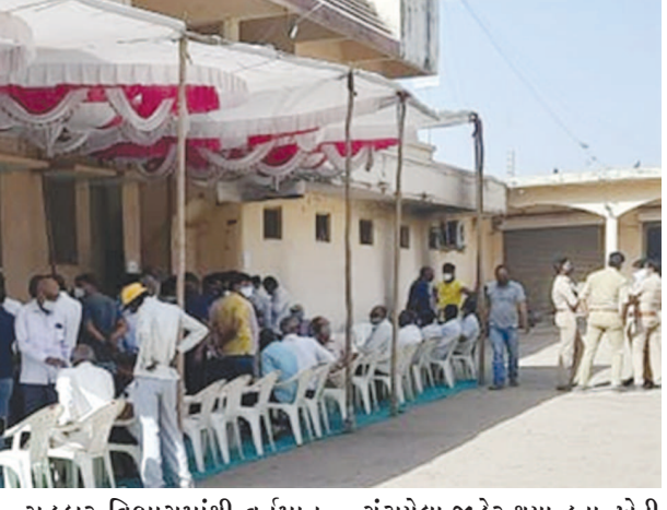
અંતિમ દિવસે ચૂંટણી ચિત્ર સ્પષ્ટ સહકાર વિભાગમાંથી વર્તમાન ચૂંટાયેલા જાહેર થયા હતા. ખેતી

વચ્ચે સત્તા માટે જંગ ખેલાશે તેવી સંભાવના વચ્ચે કોર્મ ખેંચવાના થતાં માત્ર ઓપચારીક ચૂંટણી જંગ થશે તેવું ચિત્ર સ્પષ્ટ થયું હતું.