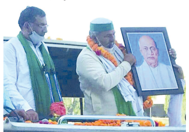
શંકરસિંહ વાઘેલા સાથે ગાંધી આશ્રમ પહોંચ્યા હતા. ગાંધી આશ્રમ ખાતે ગાંધીજીની પ્રતિમાને શંકરસિંહ વાઘેલા સાથે ગાંધી આશ્રમ પહોંચ્યા હતા. ગાંધી આશ્રમ ખાતે ગાંધીજીની પ્રતિમાને

ગાંધીનગર, તા.૫ ખેડૂત આગેવાન રાકેશ ટિકેટ ૨ દિવસના ગુજરાત પ્રવાસે છે, ત્યારે આજે પૂર્વ મુખ્યમંત્રી સુતરની આંટી પહેરાવી ટિકેટે જણાવ્યું હતું કે હવે ગુજરાતમાં પણ આંદોલન શરૂ થશે. આ આંદોલનમાં ગાંધીનગરનો ઘેરાવ ખેડૂત આગેવાને રાકેશ ટિકેટે જણાવ્યું હતું કે ભાજપમાં અમારા કારણે ભય ફેલાઈ રહ્યો છે. અત્યારે ખેડૂત આંદોલન શાંતિપૂર્ણ રીતે ચાલી રહ્યું છે, ધરણાં શાંતિથી ચાલી રહ્યાં છે. ગુજરાતમાં જે રીતે ખેડૂતોની જમીન છીનવાઈ રહી છે એ રીતે સમગ્ર દેશમાં પણ છીનવાઈ રહી છે. ગુજરાતના ખેડૂતોને પણ અનેક સમસ્યા છે પણ તેમની પાસે જબરદસ્તી ખોટું બોલાવાય છે. ઉ રૂપિયે ડિલો બટાટા મળવાની વાત છે, પરંતુ ઉ રૂપિયે ડિલો તો ગોબર પણ મળતું નથી. તો ખેડૂત શું કમાશે.