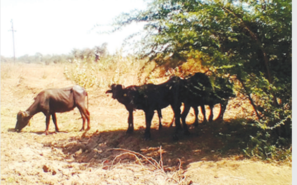
જિલ્લાના ઈડર અને બાયડમાં અગનવર્ષા થઈ હોય તે રીતે તાપમાનનો પારો ૪૧ ડિગ્રીને આંબી જતાં પ્રજા, પશુ-પંખી અને વેપારીઓ અકળાયા હતા. આજથી ૨ દિવસ તાપમાનનો પારો ૧ થી ૨ ડિગ્રી વધે તેવી હવામાન વિભાગે આગાહી કરી છે. સતત વધતા કોરોનાના સંક્રમણમાં ગરમીનો પારો ઉચકાતાં તંત્રને બે મોરચે લડવાની નોબત આવી છે.

બાયડ (બ્યુરો ઓફિસ) તા.૦૫ ગરમીમાં રાહત જોવા મળી પરંતુ ફરી તાપમાનનો પારો ઉચકાઈ રહ્યો છે. સોમવારે બપોર બાદ તાપમાનનો પારો અનેક વિસ્તારોમાં ૪૦ થી ૪૧ ડિગ્રીની સપાટીએ પહોંચ્યો હતો જેના કારણે માગો ઉપર વાહનોની પાંખી હાજરી જોવા મળી. ગ્રામ્ય વિસ્તારોના માગો સુમસામ જોવા મળ્યા હતા. કેટલાક સેવાભાવિઓ દ્વારા ગરમી વધતાં પંખીઓ માટે પાણીનાં કુંડાંનું વિતરણ શરૂ કર્યું છે. હવામાન વિભાગનું માનીએ તો બાયડ, ઈડર, મોડાસા, ભિલોડા