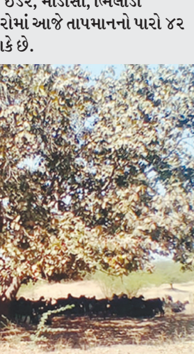
ગરમી વધતાં પ્રજાને વૃક્ષોનું મહત્વ સમજાઈ રહ્યું છે. ઠેક ઠેકાણે વૃક્ષાઈદન પ્રવૃત્તિએ માજા મૂકી છે ત્યારે કાળઝાળ ગરમીમાં મૂંગા પશુઓ છાંચડો શોધતા જોવા મળ્યા હતા.

સહિતના વિસ્તારોમાં આજે તાપમાનનો પારો ૪૨ ડિગ્રીને આંબી શકે છે.