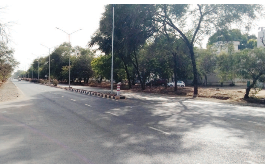
દરમિયાન શહેરના આકાશમાંથી વરસાદ ગરમી નાગરિકોને પરેશાન કરવા સાથે

ગાંધીનગરમાં ઉનાળાનો દાહ હવે દેહને દઝાડી રહ્યો છે અને આકરા તાપથી નાગરિકો ત્રસ્ત થઈ રહ્યા છે. હજુ તો એપ્રિલ મહિનાનો માંડ પ્રારંભ થયો છે ત્યાં તો ગરમીનો પારો કુદકેને ભુસકે આગળ વધી રહ્યો છે. દિવસ કપાઈ ગયેલા અસંખ્ય વૃક્ષોની યાદ અપાવી રહી છે. શહેરમાં છેલ્લા ચાર દિવસથી મહત્તમ પહોંચ્યો છે જ્યારે લઘુત્તમ તાપમાન પણ ગઈકાલ કરતા અઢી ડિગ્રી વધુ અને તા. ૩૭ ગરમી અને કોરોના કેસો સાથે યોજાઈ રહેલી ચુંટણીના પ્રચારમાં પણ ઉમેદવારો દ્વારા વહેલી સવારે અને સાંજના સમયે જ ડોર ટુ ડોર પ્રચાર કરવાનું પસંદ કરવામાં આવી રહ્યું છે કેમ કે બપોરના સમયે સખત ગરમીના વાતાવરણમાં ડોર ટુ ડોર ફરવું પણ ખૂબ આકરુ હોય છે તેમજ બપોરે ગરમીથી ત્રસ્ત થઈને વામકુશ્મી માણી રહેલા નાગરિકોને ડિસ્ટર્બ કરવામાં મતદારો નારાજ થઈ શકે છે. જેથી બપોરના સમયનો પ્રચાર બુમરંગ સાબિત થઈ શકે છે. બીજી તરફ ગરમીના કારણે શહેરીજનો એ સી-પંખાના શરણે જોવા મળી રહ્યા છે અને બપોરના સમયે સરકારી કચેરીઓથી માંડીને બજારોમાં તથા મુખ્ય માર્ગો પર વાતાવરણ તદ્દન શુષ્ક ભાસી રહ્યું છે.