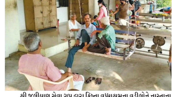
શ્રી જલીયાણ સેવા ગ્રુપ દ્વારા કિષ્ના વૃધ્ધાશ્રમના વડીલોને નાસ્તાના પેકેટનું વિતરણ કરવામાં આવ્યું હતું. તેઓનું સ્વાસ્થ્ય સારું રહે તેવી શુભ ભાવના પણ વ્યક્ત કરવામાં આવી હતી.