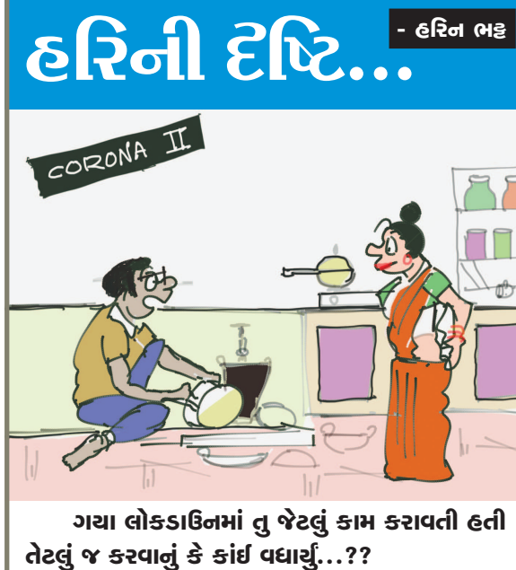
ગયા લોકડાઉનમાં જે તેટલું કામ કરાવતી હતી તેટલું જ કરવાનું કે કાંઈ વધાર્યું...??

પ્રમાણમાં ક્યારે વધશે તે વિકટ પ્રશ્ન છે. નાની-મોટી ખાનગી હોસ્પિટલો પણ ઓક્સિજનનો જથ્થો મેળવવા રોજરોજ કાંઈક ચડે છે. અને આ સમસ્યા નાની સુની નથી. કોરોનાના રામબાણ ઈલાજ તરીકે વપરાતા રેમડેસિવિર ઈન્જેક્શનની અસર આજે