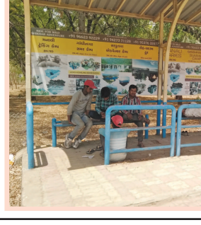
આકરા ઉનાળોનો પ્રારંભ થઈ ચુક્યો છે. દિવસે જાણે આકાશમાંથી અંગારા વરસી રહ્યા છે. સૂર્યનારાયણ તેમનો આકરો મિત્રજ દર્શાવી રહ્યા છે. બપોરે પડતો આકરો તડકો થકવી નાંખે છે. ગાંધીનગર રાજ્યનું હોટેસ્ટ સીટી બની રહ્યું છે. અમદાવાદ કરતાં પણ વધુ ગરમી ગાંધીનગરમાં પડી રહી છે. આવી કાળજાળ ગરમીમાં શ્રમિકો ઠંડક અને છાંયડા માટે બસ સ્ટેન્ડનો સહારો લઈ રહ્યા છે. બસ સ્ટેન્ડ તેમના માટે આશીર્વાદ સમાન બની રહ્યા છે.

હતી. પોલીસે ગામ, મહોલવા, શેરીઓ, અને ખેતરો તેમજ બોરકુવા પણ ખુંદી વળ્યા હતા. ત્યારે ગુરુવાર સવારે મહિલા રાજપુર ગામની સીમમાં બંધરકુવા પર હોવાની માહિતી મળી હતી. જેથી પોલીસની ટીમ તાત્કાલીક ત્યાં પહોંચી ગઈ હતી. પરંતુ તે પહેલા આરોપી ભાગી ગયા હતા.