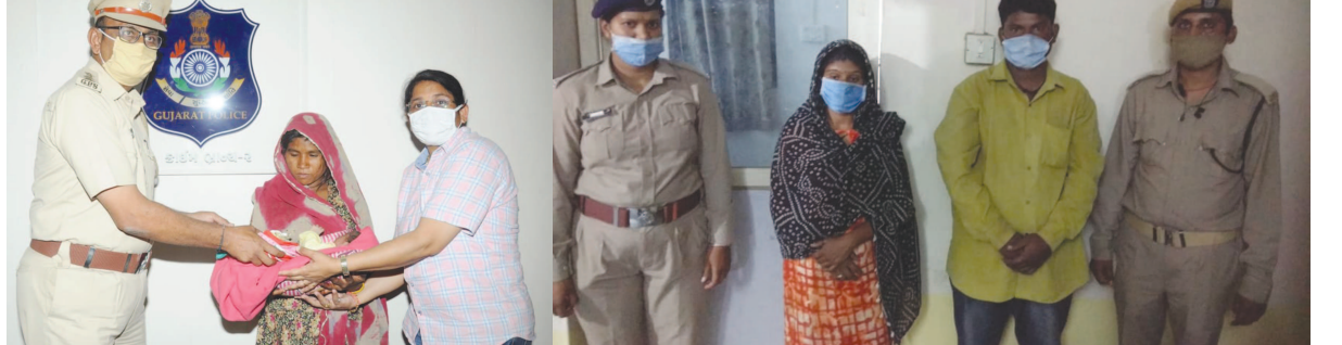
અરસામાં ગાયત્રી દેવની ટાંકા તોડાવવા અને અને બાળકનું એસઓજી, સેક્ટર-૭, સહિત પોલીસની ૧૨ ટીમો વિવિધ દિશામાં

બાતમીદારોને પણ સક્રિય કરીને માહિતી મેળવવા પ્રયાસ કર્યા હતા. પોલીસની ટીમો દ્વારા ચોવીસ કલાક ગાંધીનગર શહેરી વિસ્તાર, સિવિલ હોસ્પિટલ, અડાલજ, કલોલ, જિત્રાલ નંદાસણ, કડી સહિત આસપાસના ગામ અને હાઈ વે પરના અંદાજીત ૨૦૦ થી વધુ સીસીટીવી ફુટેજ ચેક કરી ૫૦૦ થી વધુ રીક્ષા ચાલકોની પુછતાછ કરી