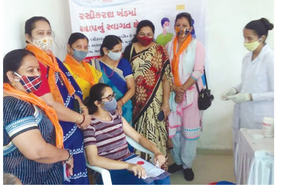
સાબરકાંઠા જિલ્લા-હિંમતનગર શહેર બક્ષીપંચ મોરચા દ્વારા રસીકરણ કાર્યક્રમ યોજાયો

કોરોનાની મહામારી વકરી છે ત્યારે ગુજરાત માધ્યમિક અને ઉચ્ચતર માધ્યમિક શિક્ષણ બોર્ડ-ગાંધીનગરની તા.૨૫ એપ્રિલે યોજાનારી ચૂંટણી મુલતવી રાખવાનો ચૂંટણી અધિકારી અને સચિવ દ્વારા નિર્ણય કરાયો છે. મુલતવી રહેલી ચૂંટણીમાં અત્યાર સુધી પૂર્ણ થયેલી ચૂંટણી પ્રક્રિયા સિવાયની બાકી રહેલ ચૂંટણી પ્રક્રિયા મુલતવી રાખવામાં આવી છે. કોવિડ-૧૯ની પરિસ્થિતિના સંજોગો ધ્યાને લઈ બોર્ડની સામાન્ય ચૂંટણી-૨૧ની મતદાન તારીખ, મત ગણતરી તારીખ, પરિણામ જાહેરાતની તારીખ અને ચૂંટાયેલા ઉમેદવારોના નામ રાજ્યપત્રમાં પ્રસિદ્ધ કરવાની તારીખના નવા તબક્કાઓની જાહેરાત નવેસરથી કરવામાં આવશે. કપરા કાળમાં વિવિધ સંવર્ગના ૯ બેઠકોના ઉમેદવારોએ પ્રચાર કાર્ય શરૂ કર્યું છે પરંતુ કોરોનાના કારણે ચૂંટણી મુલતવી રહી છે. માધ્યમિક શિક્ષણ બોર્ડની ચૂંટણીનું મહત્વ જોવા મળ્યું કારણ કે સરકાર અને તેના શિક્ષણ વિભાગે લોકશાહી ઢબે ચૂંટાઈને આવતા બોર્ડ સભ્યોની પાંખો કાપવાનો પ્રયાસ કર્યો અને માત્ર ૯ બેઠકોમાં જ સંતોષ માનવો પડ્યો. રાજ્યભરના શાળા માધ્યમિક, વિવિધ ઘટક સંધોના સંગઠનો પણ સરકારના નિર્ણય સામે એક રીતે ધૂંટણો ટેકવી દેતાં આ મુદ્દો શિક્ષણ જગતમાં ટોક ઓફ ધ ટાઉન બન્યો છે. બોર્ડમાં અવાજ ઉઠાવનારા કેટલાક સભ્યો સામે કીત્રાખોરી ભરી કામગીરી કર્યાના પણ આરોપ લાગેલા છે ત્યારે વારંવાર પાછી ઠેલાતી માધ્યમિક શિક્ષણ બોર્ડની ચૂંટણીને ફરી એકવાર ગ્રહણ લાગ્યું છે. ૨૫ એપ્રિલે યોજાનારી ચૂંટણી હાલ પૂરતી કોરોનાની વિકટ સ્થિતિના કારણે મુલતવી રાખવાનો ચૂંટણી અધિકારી ડી. એસ. પટેલે આદેશ કર્યો છે.