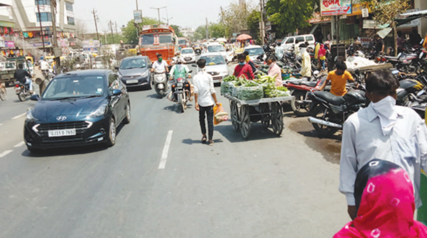
બાયડ, ભિલોડા, મોડાસાના વેપારીઓએ સ્વયંભૂ બંધનું એલાન આપ્યા પછી સફળ રહેતાં કોરોના ઉપર ધીરે ધીરે વિસ્તારોમાં લગનસરા તેમજ અન્ય અવસરોના કારણે પ્રજાની

કોરોનાની બીજી લહેર કેવી મહામારી નોતરશે તેનો અંદાજ ખુદ વૈજ્ઞાનિકો લગાવી શક્યા નથી. જેમ દિવસ પસાર થાય તેમ કોરોનાના દર્દીઓમાં ઉછાળાની સાથે કોરોના અનેક નવા વિસ્તારોની મુલાકાતે પહોંચતો હોય તેવી વિગતો પ્રકાશમાં આવી રહી છે. સાબરકાંઠા, અરવલ્લીના ૬૦૦ થી વધુ ગામોમાં કોરોનાનું સંક્રમણ પહોંચ્યું છે. આ માત્ર આરોગ્ય વિભાગના દફતરે નોંધાયેલા દર્દીઓના આંકડા પછીનું આંકલન છે. પરંતુ ખાનગી આંકડા જો સામે આવી જાય તો જિલ્લાના ૮૦ ટકા ગામડાઓમાં કોરોનાએ પગપેસારો કર્યાની વિગતો સામે આવે તેમ છે.