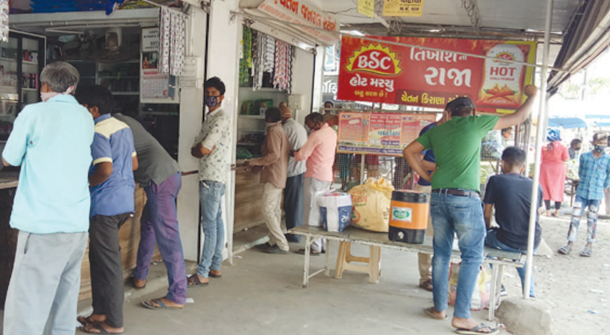
સંક્રમણ બેકાબુ બનતાં બાયડ-ભિલોડામાં શનિ-રવિ અને જડબેસલાક રહ્યા પછી સોમવારે બજાર ખુલતાં ત્રણેય તાલુકા સામે આવી. સોશયલ ડિસ્ટન્સ, માસ્ક પહેરવાનું ભૂલાતાં ૨

બાયડ (બ્યુરો ઓફિસ) તા. ૧૨ મોડાસામાં રવિવારે વેપારીઓ મહકોમાં ખરીદી માટે ભીડ જામમાં ટ્રાફિકજામ જેવી સ્થિતિ દિવસનું જોડસલવાક લોકડાઉન એળે જાય તેવા દ્રશ્યો જોવા મળ્યા. ખરીદી માટે લોકોની ભીડ ઉમટતાં કોરોનાનું સંક્રમણ વધવાની દહેશત છે. બાયડના અનેક વેપારીઓએ માસ્ક પહેર્યા વગર આવેલા ગ્રાહકોને પરત ધકેલી કોરોના સામેની લડાઈમાં તંત્રને અમૂલ્ય સહયોગ આપતા હોય તેવા દ્રશ્યો પણ ક્યાંક જોવા મળ્યા. જિલ્લામાં માસ્ક નહીં પહેરનારા લોકો પાસેથી રૂ. ૧૦૦૦નો દંડ વસુલવાની પોલીસ મહાનિર્દેશકની જાહેરાત ફારસરૂપ સાબિત થઈ છે. ઠેક ઠેકાણે સોશયલ ડિસ્ટન્સ અને માસ્ક પહેરવાનું ભુલાતાં કોરોના પ્રત્યે જાગૃત બનેલા લોકોમાં આવાં દ્રશ્યો જોઈ બિત્તતા જોવા મળી.