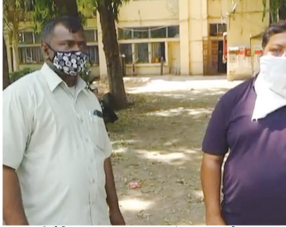
વાત્રકની કોવિડ હોસ્પિટલમાં કોરોના દર્દીનો મૃતદેહ બદલાઈ જવાની

મળતાં મામલો બાયડ પોલીસ સ્ટેશને પહોંચ્યો. જો કે મૃતકનો મલાજો જાળવવા પરિવારે થોડો