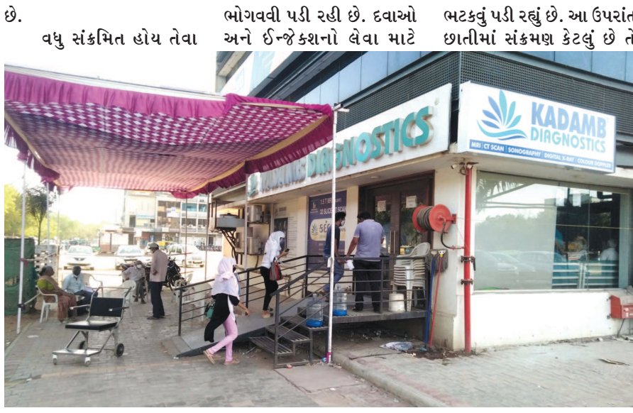
દર્દીઓને ખૂબ જ તકલીફો દર્દીઓના સગાઓને ઠેર-ઠેર જાણવા માટે સીટી સ્કેન રીપોર્ટ

ગાંધીનગર, તા. ૧૭ કોરોનાના દર્દીઓની મુશ્કેલીઓનો અંત આવતો દેખાતો નથી ટેસ્ટ, દવાઓ અને ઈન્જેક્શનો લેવા માટેની લાંબી કતારો હજી ઓછી થઈ નથી ત્યાં સીટી સ્કેન માટે કોરોનાના દર્દીઓને લાંબી લાંબી કતારોમાં ઉભા રહેવું પડે છે. ૨૪-૨૪ કલાકે નંબર આવે તેટલી લાંબી કતારો જોવા મળી રહી છે. કોરોનાનો વિકરાળ પંજો વધુને વધુ ફેલાતો જ જાય છે માર્ય મહિનાથી વધી રહેલા કેસો ધટવાનું નામ નથી લઈ રહ્યાં. આખી આખી સો સાયટીઓ આખે આખા પરિવારો સંક્રમિત બન્યા છે. હોસ્પિટલોમાં ક્યાંય જગ્યા નથી. દર્દીઓને નાછૂટે, મજબૂરીમાં ઘરે રહીને સારવાર કરાવવી પડી રહી છે.