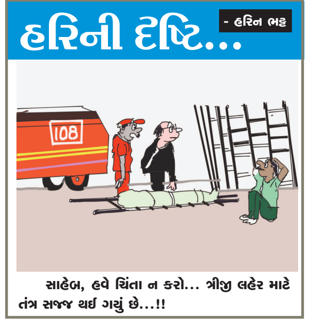
સાહેબ, હવે ચિંતા ન કરો... ત્રીજી લહેર માટે તંત્ર સજ્જ થઈ ગયું છે...!!

સુધી રક્તદાન ના કરે તે ઈચ્છનીય હોય છે કેમ કે તેની રોગ પ્રતિકારક શક્તિ નબળી પડેલી હોય છે. આ