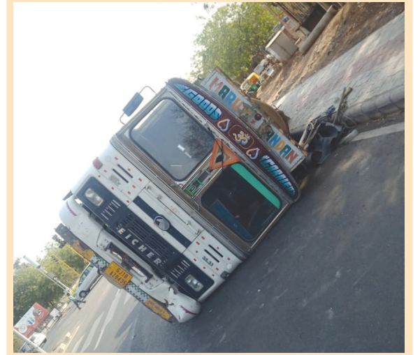
ખ-૩ પાસે ટ્રક પલ્ટી ગઈ શહેરના 'ખ' માર્ગ પર સવારના સમયે ખ-૩ પાસે અચાનક ટ્રક ડ્રાઈવરે સ્ટીયરીંગ પરનો કાબુ ગુમાવી દેતા ટ્રક પલ્ટી ખાઈ ગયો હતો.