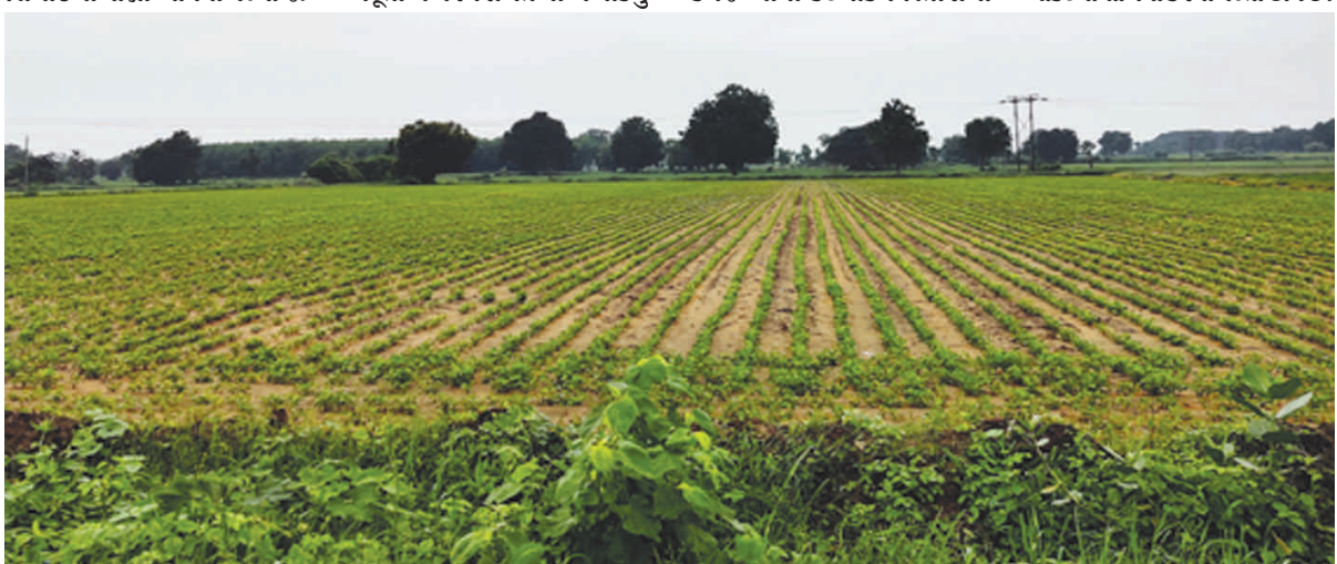
કે ત્યારબાદ વરસાદે ખેડૂતોની પ્રાર્થના સાંભળી લેતાં સાર્વત્રિક મેઘમહેર થઈ છે જેના કારણે હવે વાવેતર કરવાની સાથે કઠોળનું પણ વાવેતર કર્યું છે. સમયસર વરસાદે પધરામણી કરતાં ગત વર્ષની ખરીફ વાવેતર થયા પછી ભૂંડ તેમજ નિલગાયોથી ભેલાળ વધતાં ખેડૂતો વાવેતર બચાવવા માટે જેથી વર્તમાન સીઝનમાં પણ ખેડૂતોને નસીબના સહારે ખેતરોમાં મોલુદાટ બિયારણ ધરખી દીધું છે.

કે ત્યારબાદ વરસાદે ખેડૂતોની પ્રાર્થના સાંભળી લેતાં સાર્વત્રિક મેઘમહેર થઈ છે જેના કારણે હવે ખેતીને ફાયદો થવાની સંભાવના વધી છે. સાબરકાંઠા, અરવલ્લી જિલ્લામાં ખરીફ સીઝનમાં ખેડૂતોએ પરંપરાગત ધાન્ય પાકનું સરખામણીએ આ વર્ષે ચોમાસુ સારું રહ્યું તો બમ્પર ઉત્પાદન થવાની આશા ખેડૂતો રાખીને બેઠા છે. જો કે જિલ્લાના કેટલાક વિસ્તારોમાં ખેતરમાં રાત ઉજાગરા કરતા જોવા મળી રહ્યા છે. ખેતીની દરેક સીઝનમાં ખેડૂતોએ હવામાન તેમજ અન્ય સંકટનો સામનો કરવો પડતો હોય છે.