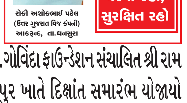
ઘરમાં રહો, સુરક્ષિત રહો