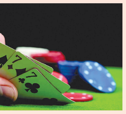
ર. ૧ જ પોલિસ વડાએ દારૂ-જુગાર, ડ્રગ્સ સહિતની બંદી નેસ્તનાબૂદ કરવા માટે તમામ જિલ્લા પોલિસ વડાઓને આદેશ આપ્યા છે પરંતુ અરવલ્લી જિલ્લામાં આદેશનું પાલન કરવાને બદલે તેની વિરૂદ્ધમાં કામગીરી થતી હોય તેવી લોકચર્ચાએ જોર પકડ્યું છે. દારૂની બંદી ઉપર જિલ્લા પોલિસ અને એલ.સી.બી. અંકુશ લાવવામાં નિષ્ફળ રહી છે અને હવે પોલિસે જુગારધામ માટે અંદરખાને મૂકસંમતિ

રવાયે યડી બરબાદ થઈ જાય તેવો ભય અનેક લોકોને સતાવી રહ્યો છે. રાજ્ય પોલિસ વડાએ અરવલ્લી જિલ્લામાં શરૂ થઈ ગયેલા જુગારધામ ઉપર ગાંધીનગરથી ટીમો મોકલી તપાસ કરાવે તો સ્થાનિક પાખી વર્દીની સાંદગાંઠનો પદાંકાસ થઈ શકે છે.