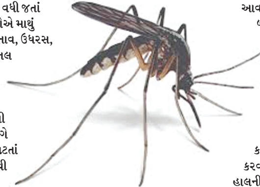
ફેલાઈ રહ્યું છે. જરૂર ઘટ્યું છે પરંતુ મચ્છરોના ઉપદ્રવને નાથવામાં બેદરકારી રાખવામાં આવી તો મેલેરીયા અને કેન્સિયુના કેસ વધવાથી આરોગ્ય વિભાગની પરેસાનીમાં ઓર વધારો થવાની આશંકા છે. બંને જિલ્લામાં ચોમાસાની સીઝનમાં પ્રજાનું આરોગ્ય કથળ્યું હોવાથી પાનગી દવાખાના તેમજ હોસ્પિટલોમાં સારવાર લેવા માટે આવતા દર્દીઓની દૈનિક સંખ્યામાં બમણો વધારો થયો છે.

દવાખાના દર્દીઓથી ઉભરાઈ રહ્યા છે. છેલ્લા એક સપ્તાહથી વાદળછાયું વાતાવરણ, હવામાં ભેજનો વધારો તેમજ મચ્છરોનો ઉપદ્રવ બેકાબૂ બનાવતાં મેલેરીયા તેમજ કેન્સિયુના કેસ બહાર આવી રહ્યા છે. આરોગ્ય વિભાગ દ્વારા વર્તમાન સિઝનમાં તકેદારી રૂપ કામગીરી કરવામાં કયાશ રાખવામાં આવશે તો વાયરલ બીમારીઓથી ઘેર-ઘેર મેલેરીયાના પાટલા જોવા મળી શકે છે. કોરોનાકાળના સમયગાળામાં ફરજિયાત મારસ્ક તેમજ સોશયલ ડિસ્ટન્સના નિયમોનું કળકાઈથી પાલન કરવામાં આવ્યું જેથી હાલની સ્થિતિએ સંક્રમણ જરૂર ઘટ્યું છે પરંતુ મચ્છરોના ઉપદ્રવને નાથવામાં બેદરકારી રાખવામાં આવી તો મેલેરીયા અને કેન્સિયુના કેસ વધવાથી આરોગ્ય વિભાગની પરેસાનીમાં ઓર વધારો થવાની આશંકા છે. બંને જિલ્લામાં ચોમાસાની સીઝનમાં પ્રજાનું આરોગ્ય કથળ્યું હોવાથી પાનગી દવાખાના તેમજ હોસ્પિટલોમાં સારવાર લેવા માટે આવતા દર્દીઓની દૈનિક સંખ્યામાં બમણો વધારો થયો છે.