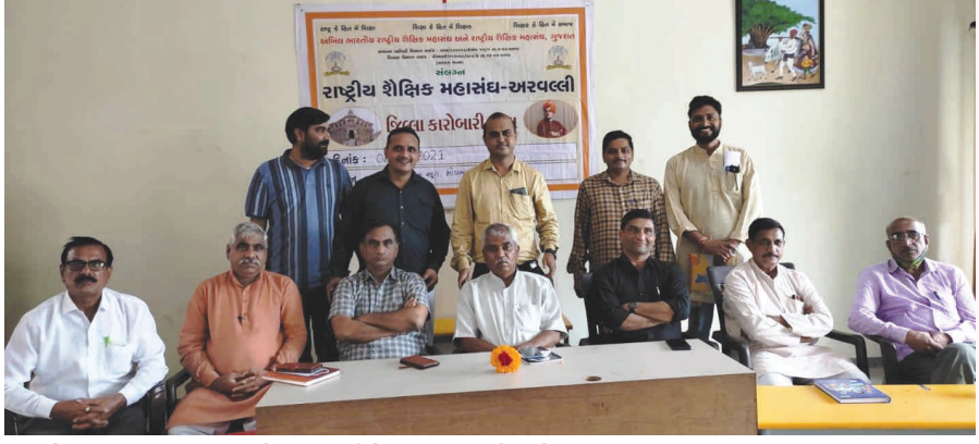
શિક્ષકોના પાયાના પડતર પ્રશ્નોના ઉકેલ માટે જિલ્લા કારોબારી બેઠક યોજવામાં આવી જેમાં જિલ્લાના ૬ તાલુકામાં સંગઠનનો વિસ્તાર શિક્ષકોના પ્રશ્નો, હક અંગે ચર્ચા કરવામાં આવી તાલુકા અને

શૈક્ષકોના પાયાના પડતર પ્રશ્નોના ઉકેલ માટે જિલ્લા કારોબારી બેઠક યોજવામાં આવી જેમાં જિલ્લાના ૬ તાલુકામાં સંગઠનનો વિસ્તાર શિક્ષકોના પ્રશ્નો, હક અંગે ચર્ચા કરવામાં આવી તાલુકા અને