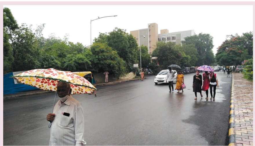
ઝરમર ઝરમર વરસાદ - અપાઠના અંતિમ ચરણમાં શ્રાવણના સરવરિયાનો અનુભવ થાય છે... દિવસમાં એકાદ બે હળવા ઝાપટા વાતાવરણને ભેજયુક્ત રાખે છે... વરસાદ પડતો નથી, તડકો આવતો નથી... અને વાતાવરણ શુષ્ક બનતું જાય છે... ભલે હીલ્સ્ટેશન જેવું લાગે પરંતુ રોગચાળાનો ભય પણ એટલો જ છે...

સેક્ટરમાં કમ્પાઉન્ડ વોલના નિર્માણ પૂર્વે ફેન્સીંગના લોટિંગ દબાણો પણ દુર કરાતાં નથી : જ્યારે ગમે તે જગ્યાએ વચ્ચે જગ્યા છોડીને વોલ તાણી બાંધવામાં આવતાં સ્થાનિકોમાં રોષ