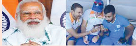
નવી દિલ્હી, તા.૫

ઓલિમ્પિકમાં મેડલ પર વડાપ્રધાનના અભિનંદન : ટોક્યોમાં હોકી ટીમે શાનદાર પ્રદર્શન કરીને જીત મેળવી છે, આ ગર્વની ક્ષણ, આત્મવિશ્વાસથી ભરેલું ભારત છે