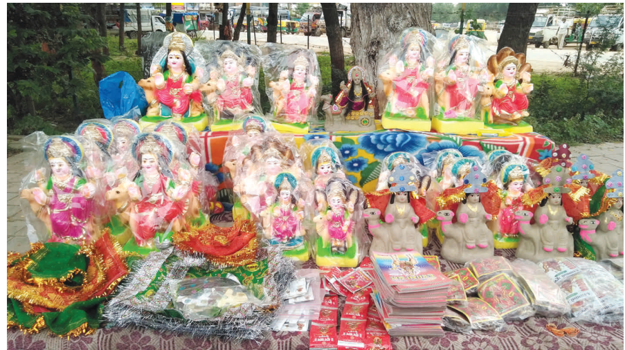
વ્રતનો પ્રારંભ થઈ રહ્યો છે. ત્યારે અર્ચના કરી ભક્તિભાવ સભર દશામાના વ્રતનો પ્રારંભ થાય છે મહિલાઓ અને શ્રદ્ધાળુઓ ઉપવાસ કરી વ્રત કરી ધન્યતા ત્યારે દશામાની મૂર્તિ ખરીદવા

માતાજીનું ભાવપૂર્વક પૂજન કરવામાં આવે છે અને ૧૦ સુતરના તાંતણની ગાંઠોવાળી કળશ પર વીંટીને મુકવામાં આવે છે. દસ દિવસ ઉપવાસ કે એકટાણા કરી મા દશામાની વ્રત કથા કરાય છે. દસમા દિવસે પારણા કરવામાં આવે છે.