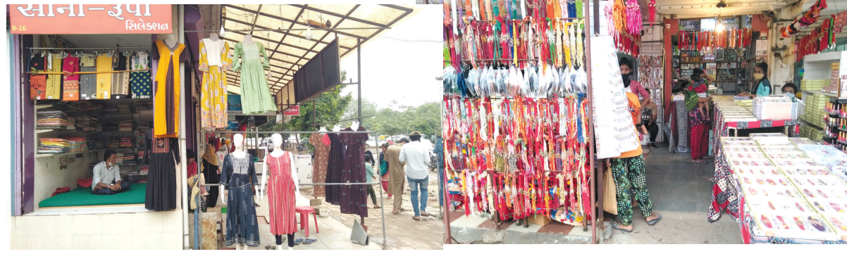
કોરોનાની બીજી લહેરની અસરમાં જોવા મળી રહેલી ભીડ બજારોમાં લોકોની અવરજવર વ્રતની હમણાં જ પૂર્ણાહુતિ થઈ બજારોમાં ભારે ભીડ જોવા મળી

શ્રાવણ મહિનો પણ શરૂ થઈ ચુક્યો છે. શ્રાવણ મહિનામાં ઉપવાસનું ખૂબ મહત્વ હોઈ ફરાળી વાનગીઓ અને કુટસ્તનું વેચાણ વધવા માંડ્યું છે. ફરાળી વાનગીઓની નવી નવી વેરાયટી બજારોમાં ખૂબ વેચાઈ રહી છે. કોરોના કાળમાં મંદ પડેલા વધારો જાગરમાં હવે તહેવારોની ચમક જોવા મળી રહી છે. બજારોમાં અવરજવર વધતા વેપારીઓમાં ઉત્સાહ જોવા મળી રહ્યો છે. આગામી દિવસોમાં વધુ વ્યાપાર-ધંધો વધશે તેવું વ્યાપારીઓનું મંતવ્ય છે.