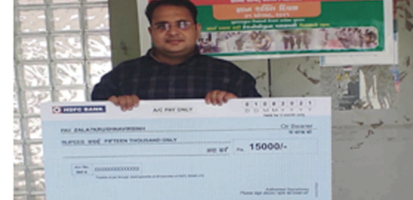
'હાઈ કવોલિટી રિસર્ચ' માટે શોધ યોજના અંતર્ગત બે વર્ષના કુલ ચાર લાખ રૂપિયા ગુજરાત સરકાર દ્વારા પાસ કરાયા છે. ગુજરાત સરકારના