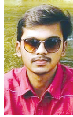
પંથ સથવારા ડેમાઈ, તા.બાયડ