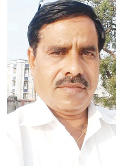
અંડવાકટ કુમ્ભાર ભરવાડ મોડાસા, જિ.અરવલ્લી