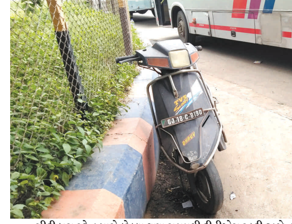
સીટી બસ સ્ટેન્ડ પાસે છેલ્લા ઘણા સમયથી ટીવીએસ સ્કુટી જીજે-૧ ૮ સી-૮ ૧૮૦ બિનવારસી હાલતમાં પડેલી છે. આ સ્કુટી ચોરીની છે કે અન્ય કોઈ કારણસર તે અહીં પડી છે તે તપાસનો વિષય છે.

મેટ્રો પ્રોજેક્ટના વાહનો માટે બંધ કરવા માંગ કરાવામાં આવી છે. ધોળાકુવા ગામના પ્રવેશદ્વારે ફેલાતી ગંદકીના કારણે ગ્રામજનોને અવરજવરમાં ખૂબ જ તકલીફ પડી રહી છે. એક તરફ ચોમાસાની ઋતુ હોવાને કારણે અને બીજી તરફ મેટ્રો રેલ પ્રોજેક્ટના મોટા વાહનોની અવરજવરના કારણે આ માર્ગ ઉપર કાદવકીચડનું પ્રમાણ દિનપ્રતિદિન વધી રહ્યું છે તેમજ રોજગર્ય જીવજંતુઓનો ઉપદ્રવનું જોખમ પણ તોળાઈ રહ્યું છે. શહેરના ય-૦ સર્કલથી કોથા તરફના માર્ગેથી ગુજરાત ફન વર્લ્ડ પાસેથી ધોળાકુવા ગામમાં પ્રવેશવાના માર્ગ પર આ પરિસ્થિતિ છેલ્લા ઘણા દિવસથી જોવા મળી રહી છે. જેના